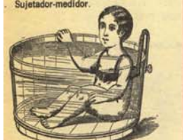
1. Niño en el momento de ser pesado para comprobar el metal que pueda llevar escondido en sus entrañas. (Método del principio de Arquímedes.)