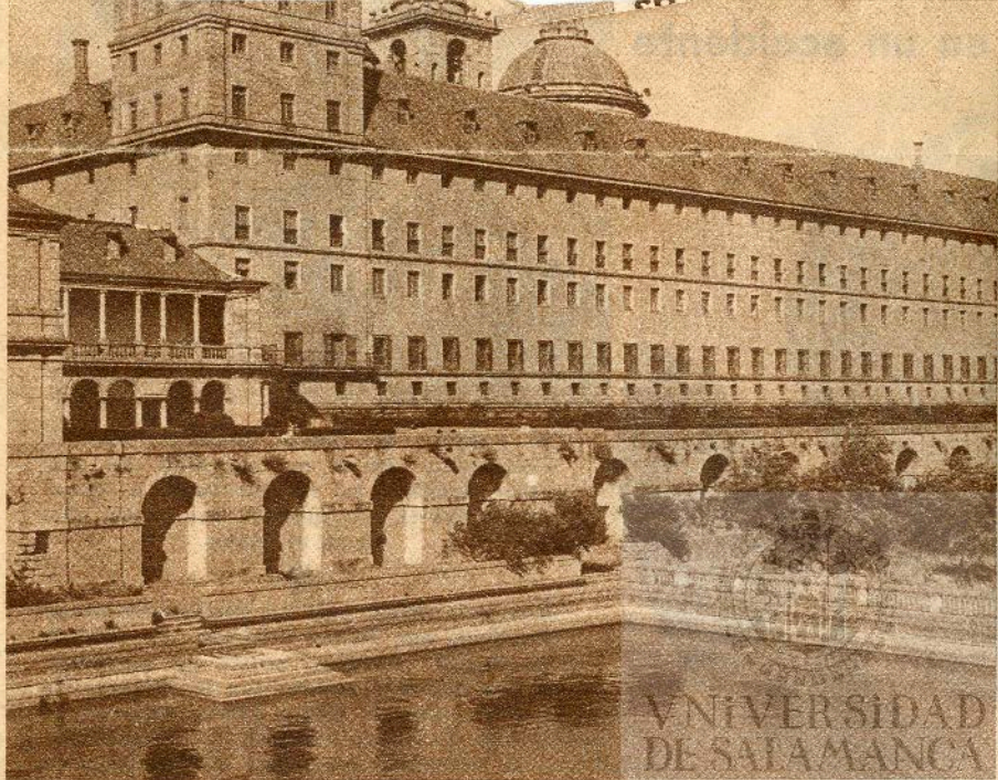
La Universidad de los Agustinos, en El Escorial