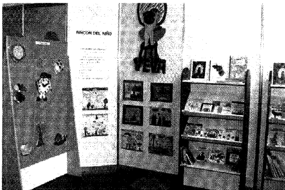
Aspecto de la exposición Muestra de recursos didácticos para la Biblioteca de Aula . →

ponga a disposición del profesorado libros, documentos diversos y experiencias en torno a la biblioteca de aula, sirva de lugar de encuentro entre las personas que desarrollan su labor en este ámbito y facilite contactos con instituciones que pueden proporcionar recursos a la escuela. El curso pasado colaboraron en esta exposición la OEPLI, la Red de bibliotecas de la Comunidad de Madrid, la Fundación G. Sánchez Ruipérez, el Seminario de Literatura Infantil y Juvenil de Guadalajara, la Asociación de maestros Rosa Sensat, la Asociación EDUCACION Y BIBLIOTECAS y la Librería de Mujeres.