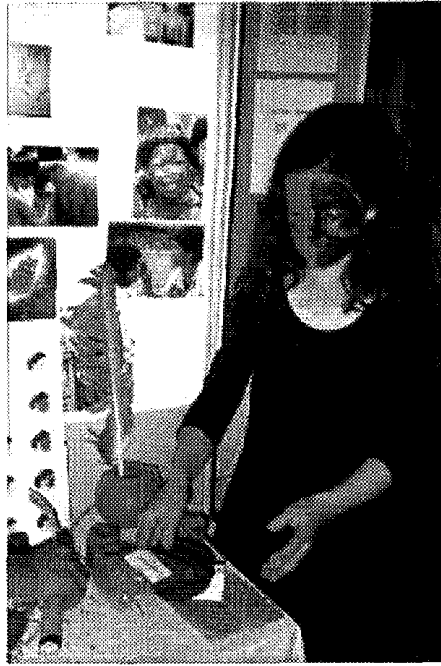
Pintura facial y corporal indígena. En la foto, una de las alumnas/monitoras de la exposición.

tín del médico, donde metieron, en bolsas hechas por ellos, cortezas, raíces, semillas, frutos, que tenían propiedades curativas.