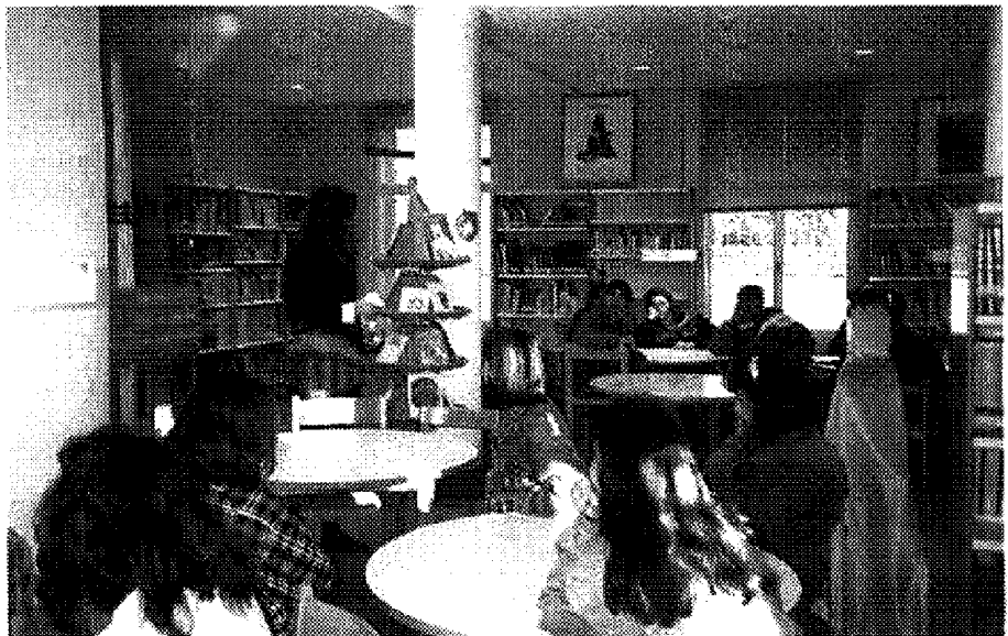
Los alumnos con los que hemos realizado la experiencia son de 2º de BUP.

En 3º de B.U.P., este objetivo debería ser más completo, iniciando a los alumnos en las técnicas bibliotecarias y de documentación: catalogación, clasificación, resúmenes, etcétera. La inexistencia de bibliotecarios escolares y la falta de interés por parte de las Administraciones Públicas implicadas dificulta, y en ocasiones impide, los