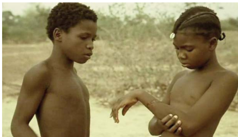
Inoculación traumática a través de la herida producida con un cuchillo en una pelea.