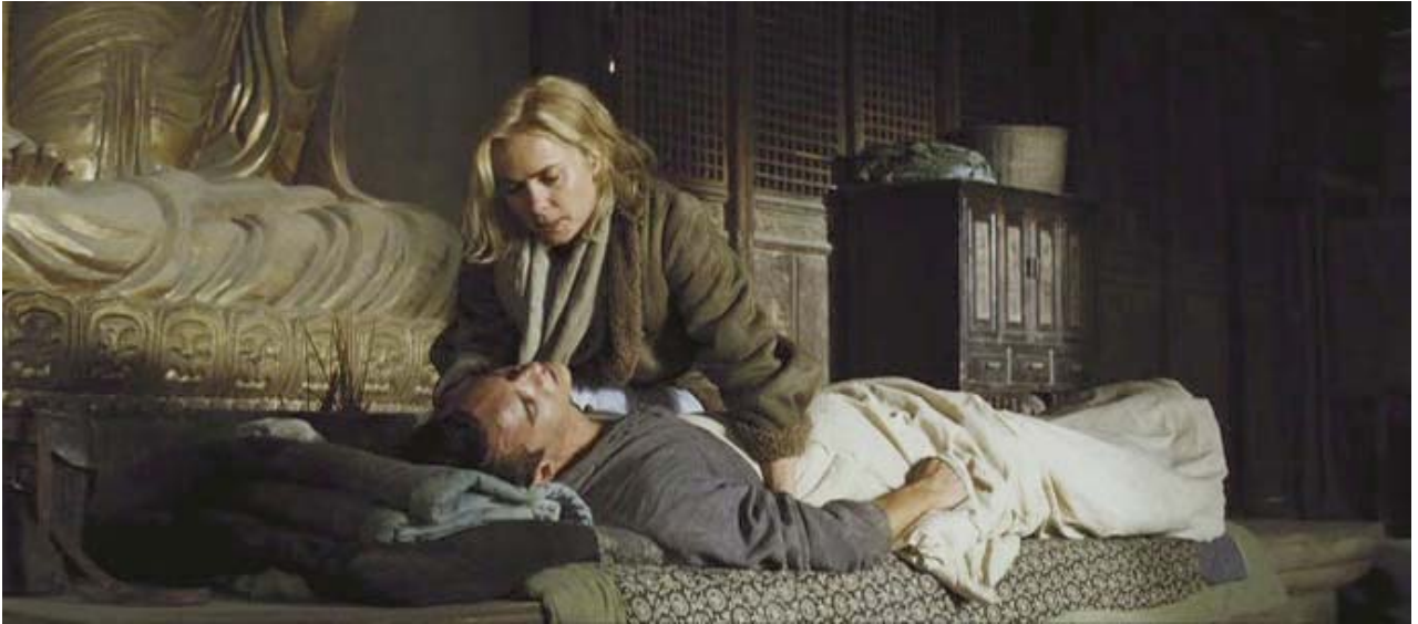
rigidez de nuca,