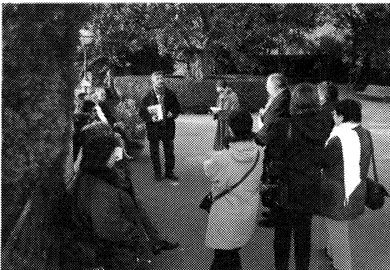
Parada nº 7. Ruta literaria. Carmen de los Mártires (Andrea, Juan C.)

Sólo se quiere lo que se conoce. Conociendo mejor su ciudad sabrán apoyar mejor su conservación y podrán transmitir en mejores condiciones este legado a las generaciones futuras.