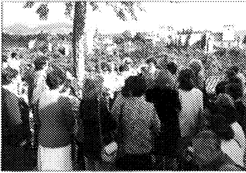
Ruta literaria por el Albaicín. Recitar poemas fronterizos. Alumnos Educación de Adultos

rado de la especialidad de Lengua y Literatura, la apertura y potenciación de actividades realizada por el equipo directivo del centro y, por otro lado, porque un barrio de más de 30.000 habitantes no cuenta con una Biblioteca Municipal.