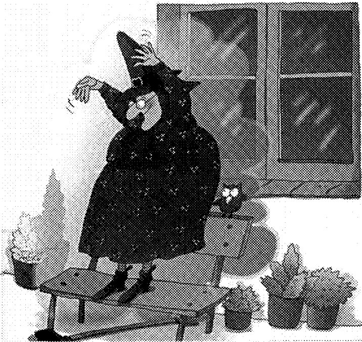
Roser Capdevila y Carles Capdevila. Las tres mellizas hacen las paces . Icaria, Intermon Oxfam y Cromosoma. 2001

miradas sorprendentes al mundillo literario de las brujas y la brujería.