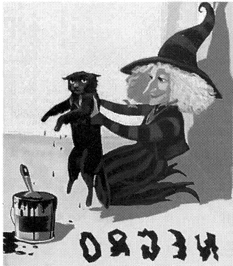
Kate Banks. La bruja y su gato . SM. 1997

También para los de Primaria hubo una cosa más. Agrupados por ciclos, fueron bajando hasta el Palacio Montcada de Fraga (donde dicen que también estuvo la bruja Urganda) para escuchar una charla y ver unas diapositivas sobre Brujas, encantarias, gigantes, duendes y seres mágicos de Ara-