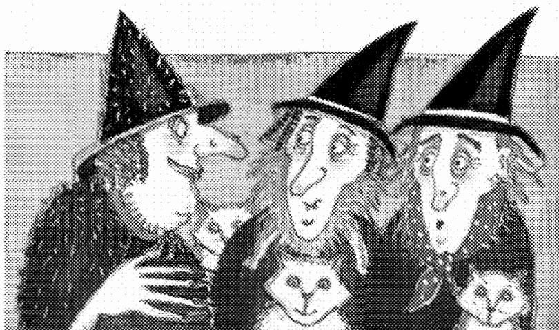
Sally Gardner. El catálogo para hadas . Serres. 2002

SEYMOUR, Peter. La bella durmiente . Madrid: Montena, 1987. (P) SOLOTAREFF, Grégoire. 3 brujas . París: Corimbo, 2001. (P y S) VÁZQUEZ-PRADA, Ricardo. El genio del Moncayo . Huesca: La Val de Onsera, 1997. (S) WILSDORF, Anne. Filomena . Barcelona: Destino, 1991. (P)