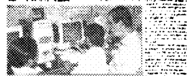
El secretario general de la Comisión Nacional del Libro de Texto Gratuito, Carlos Salazar, durante su discurso.

Salazar, en un momento de su discurso, dijo que el debate sobre libros ha sido un debate de "café" y que se ha perdido el tiempo en discutir sobre libros que no se leen.