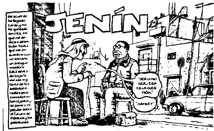
Palestina. En la franja de Gaza. Joe Sacco. Planeta-DeAgostini. 2002

Editora generalista fundada en 1869 que recientemente, tras la desaparición de Junior, se dedica a publicar en España los álbumes de las exitosas series