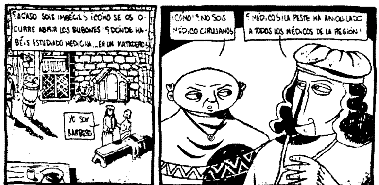
La tierra negra. Luis Durán. De Ponent. 2002

Las colecciones europeas de más renombre dan título cada una de su propia colección: "Peter Pan"