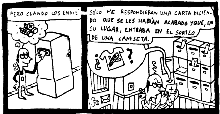
Recortes de Hostias . Mauro Entrialgo. De Ponent. 2000

Ambientado en el futuro, este cómic es probablemente el mejor ale-