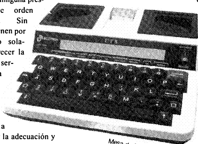
Mesa de DTS

podrían ser confiadas a un bibliotecario cualificado que tenga, además, la responsabilidad de otros servicios.