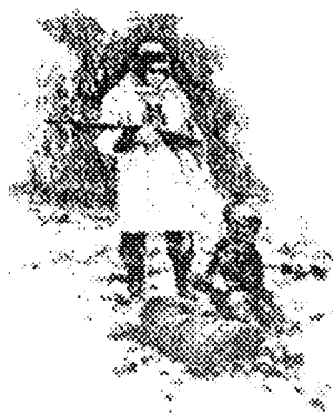
"El... bajó el fusil".

Pasado un tiempo razonable se hará una comprobación de los emparejamientos. Hecho esto se pedirá a cada pareja que localice en el libro los pasajes próximos a su ilustración, en los que tendrán que encontrar su frase. Tomando como base esos pasajes, cada pareja deberá recrear su escena, resumiéndola en el doble folio, al pie de la imagen. Los comentarios, como es lógico, serán diferentes según la edad de los participantes. Podemos ver los siguientes ejemplos de