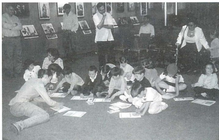
Escuchar, hablar, leer y escribir. Actividades con el lenguaje. De la Torre, 2000

Bibliotecas Escolares , coordinado por el PNTIC (en la actualidad CNICE) y la utilización del programa informático ABIES para la gestión de los fondos bibliográficos, gracias a los acuerdos firmados con distintas comunidades autónomas. Sin embargo el programa piloto se suspendió y en su lugar se pusieron en marcha el Plan de Mejora de las Bibliotecas Escolares y el Plan para el Fomento de la Lectura , entre 1997 y 2000. Dos de las actuaciones más destacadas del primero fueron la dotación extraordinaria de fondos bibliográficos para una serie de centros y la promulgación de unas directrices para la atención de las bibliotecas escolares por parte de profesores encargados de las mismas. Pero, como en otras ocasiones, estas iniciativas ni llegaron a todos los centros ni se han mantenido en el tiempo.