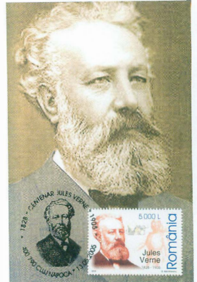
Sello Jules Verne: © Posta Romana

Poco imaginaba que sus obras aparecerían en más de 112 idiomas. Que decenas de administraciones postales honrarían su