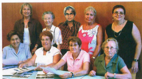
Voluntarios, jóvenes y mayores, del proyecto "Viure en temps de guerra"; Voluntarios mayores del proyecto "Viure en temps de guerra"; Mujeres voluntarias del proyecto "Treballar a la fàbrica"

parte de la línea "mejorar el aspecto diferencial del fondo".