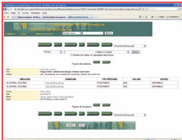
Imagen que corresponde a un menú con diferentes opciones que desarrollamos a continuación: Empezar de nuevo, Reservar (en caso de estar prestado a otra persona), Guardar registro (para su posterior visualización), Marc, Listado, Modificar búsqueda, Registros

Pulsando en cada registro, en este caso en cada autor, nos aparecen las obras de éste conservadas en alguna de las Bibliotecas de la UEX. Si buscamos por título y pulsamos en alguno de ellos, obtendremos toda la información sobre ese registro.