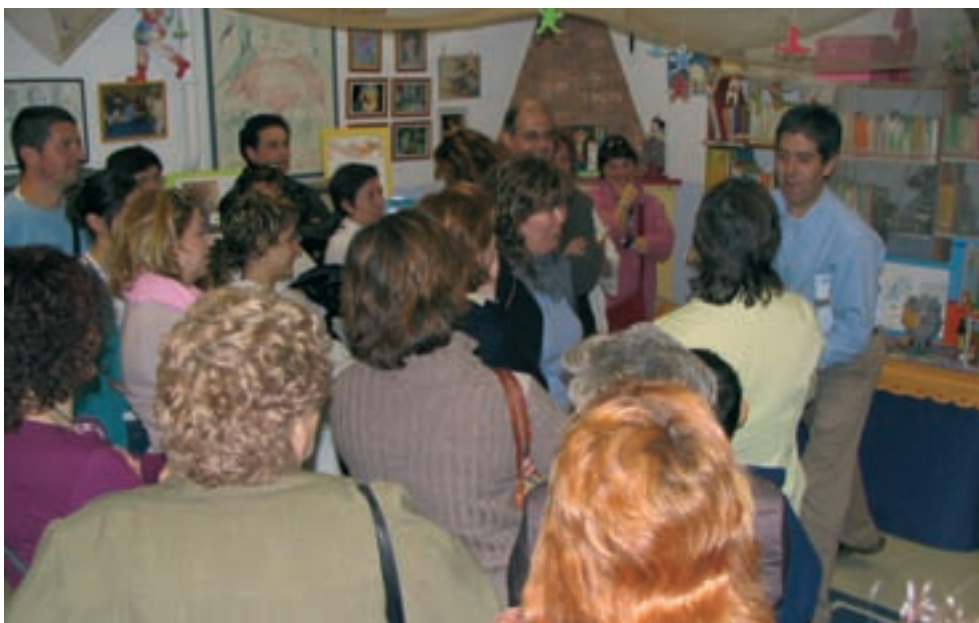
Visita de los padres y madres a la exposición.

hay que pactar con algún compañero el destino de esos euros que les sobran a cada uno.