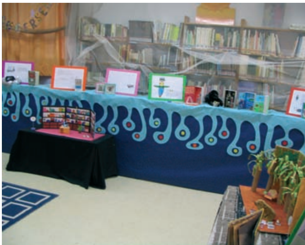
Exposición “Libros que hablan de libros” en el CEIP Sant Josep - El Pi.

...en resumen, y a riesgo de caer en paradoja, hay que admitir que lo «normal», en educación, es que la cosa «no funcione»: que el otro se resista, se esconda o se rebele. Lo «normal» es que la persona que se construye frente a nosotros no se deje llevar, o incluso se nos oponga, a veces, simplemente, para recordarnos que no es un objeto en construcción sino un sujeto que se construye.