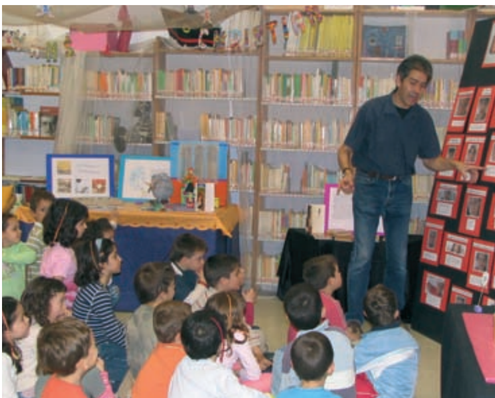
Sesión con alumnos del CEIP Sant Josep – El Pi.

La participación de los chicos y chicas en la gestión y organización de la