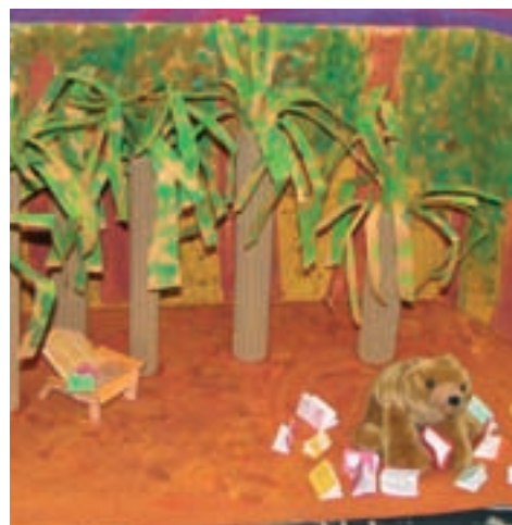
Trabajos escolares para la exposición “Libros que hablan de libros”.

biblioteca les está ayudando en su formación como lectores. Existe, además, un aspecto intrínseco en esta manera de entender la vida escolar: se potencian los lazos afectivos con el espacio y con los libros para complementar la idea de conseguir que la biblioteca sea el eje alrededor del cual gire la vida intelectual y parte de la social de la escuela.