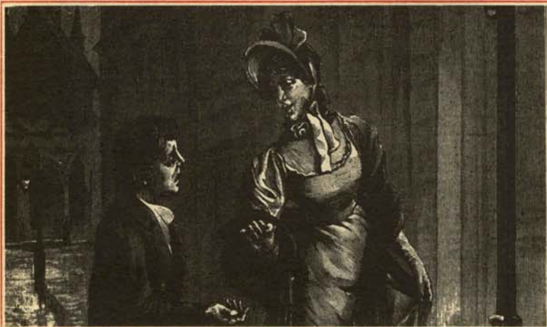
—Lo siento pero no tengo ningún pecho suelto.