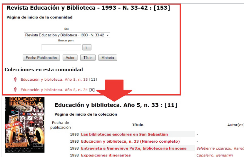
Imagen 9. Estructura “comunidad-subcomunidad-colección-ítem”

Una vez finalizados estos procesos se procedió a la carga en el repositorio. La carga masiva de la revista requirió crear previamente la arquitectura necesaria (comunidades y colecciones). Una vez cargadas las colecciones faltaba la descripción de los números completos de la revista. El sistema de creación de ítems con el número completo no estaba automatizado, como en el caso de cada uno de los artículos, por lo que se crearon manualmente.