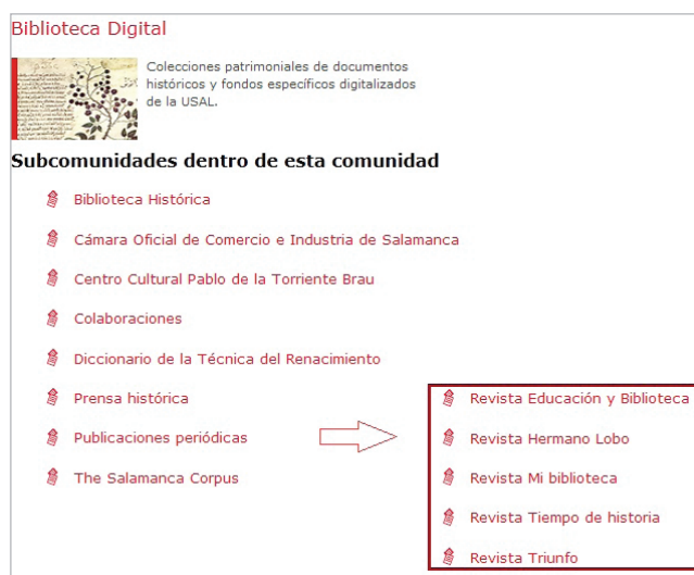
Imagen 8. Estructura de la Biblioteca digital de Gredos

Dialnet en ficheros RIS (formato de etiquetas estándar desarrollado por Research Information Systems, Inc. , que permite el intercambio de datos a los programas de gestión bibliográfica). Dialnet puede exportar las citas en este formato, como se muestra en la imagen 2.