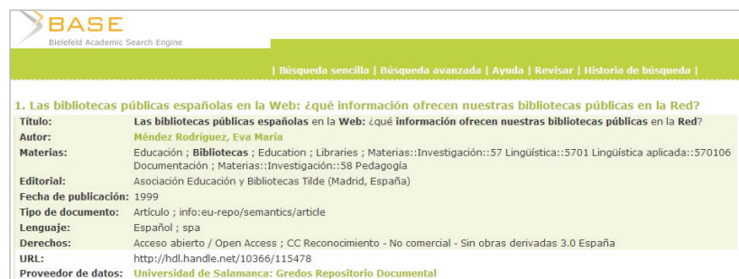
Imagen 10. Registro de EyB en Base

Educación y biblioteca es una “comunidad” dentro de la sección Biblioteca digital , estructurada en subcomunidades correspondientes a cada uno de los años de publicación de la revista, y éstas en “colecciones” correspondientes a cada uno de los números. EyB consta de 23 subcomunidades (años 1989 a 2011) y 183 colecciones (números de la revista), con 2.466 ítems (registros o contribuciones) (imagen 9).