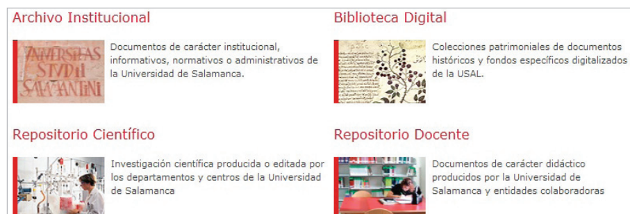
Imagen 7. Secciones de Gredos

5. Conversión automatizada de ficheros RIS a ficheros RDF ( Resource description framework ), que es un lenguaje para la representación de información sobre recursos en la Web. En el caso de Educación y biblioteca se trataba de hacer la conversión automática del formato RIS a RDF con etiquetas DCQ (como se muestra en la imagen 4) mediante un programa informático propio, de forma que se pudieran importar los ficheros resultantes en Gredos .