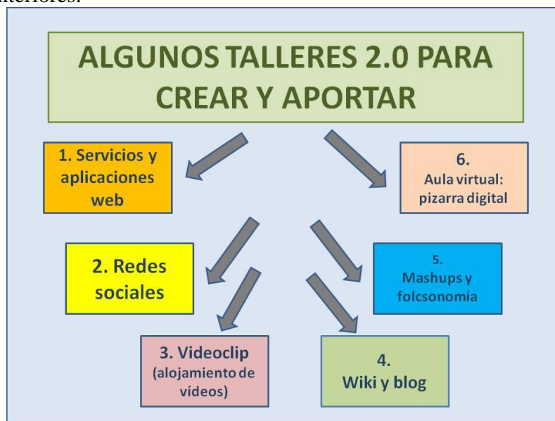
Figura 2: Talleres 2.0 para crear y aportar en la formación del profesorado. Elaboración propia.

Con espíritu deportivo es necesario entrenarse y ejercitarse con actitud creativa aportando en talleres lo que se ha ido aprendiendo y asumiendo en las sesiones formativas anteriores.