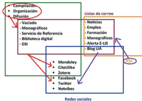
Interacción entre los canales utilizados para retroalimentar y difundir servicios