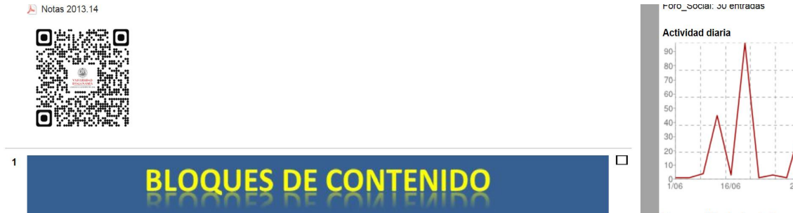
Figura nº 3. Apariencia del acceso a notas de la asignatura mediante código QR.

En la figura 2, se presenta el ejemplo de conexión a las notas de la asignatura mediante códigos QR