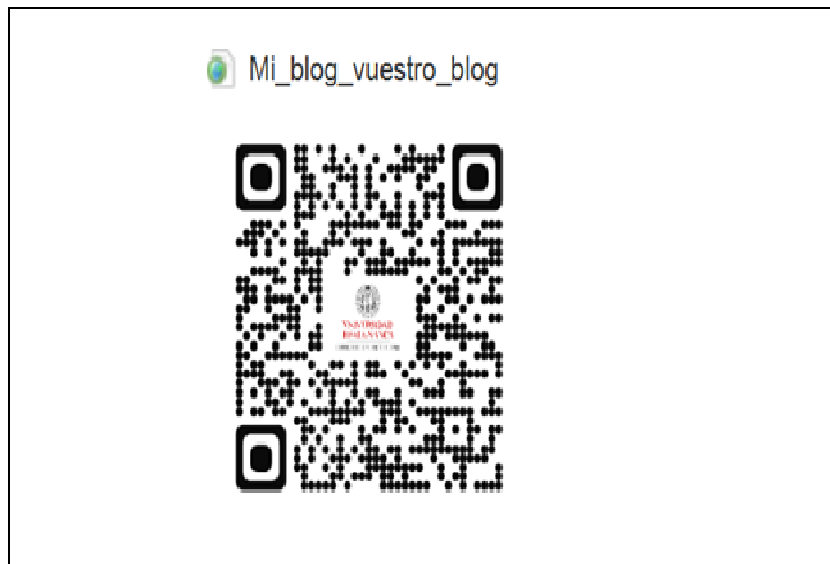
Figura nº 2. Apariencia del acceso al blog de la asignatura ( http://blogdidacticageneral.wordpress.com/ ) mediante código QR.

En la figura 2, se presenta el ejemplo de conexión a redes sociales (blog de la asignatura mediante códigos QR