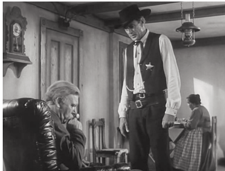
...padece una artritis reumatoide...