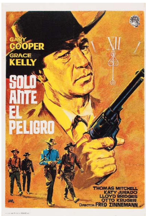
Acción: finales del siglo XIX (Hadleyville, ¿?, EEUU). Cartel español