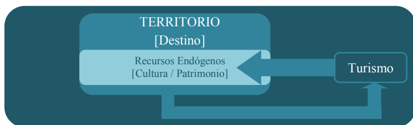
Figura 1: Relación entre el territorio y el turismo

El papel que el turismo puede desempeñar en relación con el territorio y la relación que el territorio, de manera recíproca, puede establecer con el turismo y su imbricación con los recursos endógenos, en general, y con la dimensión cultural y el patrimonio de una manera específica, son el punto de partida fundamental de esta investigación (Figura 1).