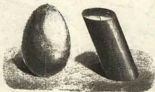
Huevo normal (1932) Huevo adulturado (1974)

¿Qué podemos decir nosotros que no diga una imagen que, como se sabe, vale más que treinta y dos palabras? He aquí la imagen: