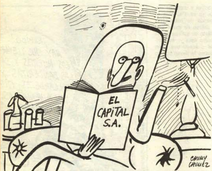
—Me encanta esta edición corregida y aumentada en diez mil millones de dólares.