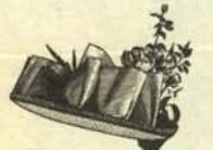
g.—Sombrero que emite apasionadas arengas en estilo heroico-arcaico. ... Y así sucesivamente.