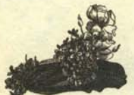
f.—Sombrero que habla con voz atiplada para uso de señoritas que prefieren ser iguales a los caballeros que no lo son demasiado.