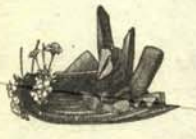
e.—Sombrero que habla como un caballero educado, es decir a gritos. También escupe salvillas.