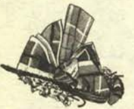
d.—Sombrero que cuenta con naturalidad que ha visto en París la película del tango y la mantequilla.