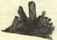
c.—Sombrero que habla perfectamente sobre todos los partidos de la liga, la copa, la recopa y la re-liga.