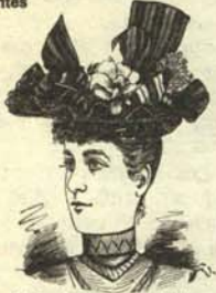
a.—Mujer igual a un caballero con su sombrero emisor.

C OINCIDIENDO con la celebración del día de la Igualdad de las Mujeres se han puesto a la venta unos modelitos de sombreros provistos de un pequeño transistor que emite frecuentemente frases inteligentes, cuftas o simplemente sensatas como las que dicen los hombres. He aquí algunos de los modelos y sus frases más frecuentes