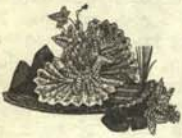
b.—Sombrero que dice frecuentemente, como cualquier caballero normal, eso de lo nefando que es el liberalismo decimonónico.