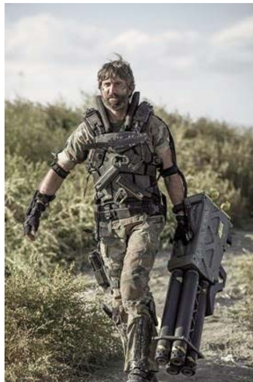
Foto 7. Algunos grupos de mercenarios o terroristas de los países pobres, reciben armas y apoyo de los países ricos.

Neil Blomkamp tuvo la inteligencia de dirigir actores norteamericanos, mejicanos, brasileños y africanos, quizás para recordarnos que existen talentos en todos los países. Blomkamp es un veterano en el tema, su anterior