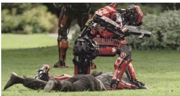
Foto 2. Los foráneos no son reconocidos como ciudadanos en Elysium y son recibidos con truculencia.

Policías armados los persiguen, los apalean y los arrestan. Los niños son testigos de la violencia ejercida contra sus padres y contra ellos mismos. En realidad, el sistema operativo de Elysium no reconoce a los foráneos como ciudadanos y solamente los ciudadanos tienen derecho a protección y salud (Foto 2).