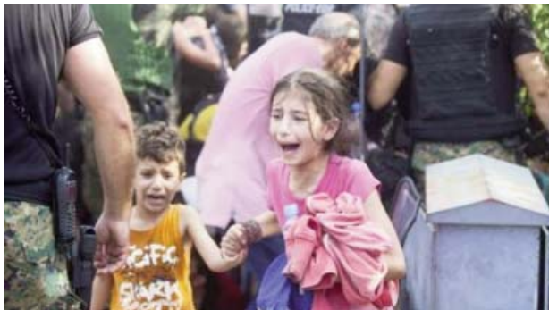
Foto 5. Niños sirios inmigrantes corren después de la represión policial.

acuerdo con su edad. Antes de los seis años aun no tienen la noción de la influencia de terceros en sus vidas, entonces se sienten culpables, pensando que si hubiesen sido obedientes por ejemplo, nada de eso (guerra o desastre) hubiera ocurrido. Tienen, también, dificultad para dormir, pesadillas y mal comportamiento. De los siete a los once años ya entienden la perspectiva del otro y precisamente por eso sienten más miedo y ansiedad. Pueden mostrar regresión, estado de hiper alerta y rumiación del hecho traumático. Los adolescentes con frecuencia guardan para si sus sentimientos lo que aumenta la depresión. Suelen tener, también, sensaciones de injusticia con deseo de venganza lo que los hace más susceptibles a la influencia de terroristas y delincuentes 1 .