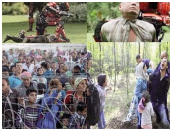
Foto 3. Similitud entre el trato recibido por invasores de Elysium e inmigrantes Sirios.

Ortega y Gasset llama a esto de heroicidad pues define a los héroes como aquellos “ decididos a no contentarse con la realidad ” 3 , aquellos que contra todo y contra todos deciden su propio destino. Sin embargo, cuando los inmigrantes actuales intentan recobrar su salud y su dignidad en otro país, son recibidos muchas veces con menosprecio. No son infrecuentes el alambre de espino, los gases lacrimógenos, las persecuciones y las detenciones. Parece que nuestro sistema, al igual que el de Elysium, tampoco reconoce como ciudadanos a esos individuos (Foto 3). La Organización Mundial de la Salud (OMS) tiene por principio que la salud es un derecho humano fundamental del que deben disfrutar todos los seres humanos sin discriminación alguna. Los grupos vulnerables y marginados de la población requieren atención prioritaria 4 .