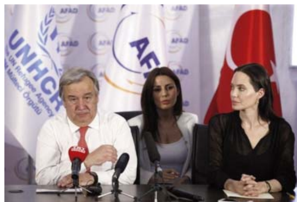
Foto 8. La actriz Angelina Jolie en una reunión con el alto comisionado de la ONU para los refugiados.

En definitiva, distribuir los aglomerados humanos en las fronteras solamente tendrá un efecto paliativo. La inmigración en masa solamente acabará cuando los ciudadanos de los países pobres adquieran condiciones de vida mínimamente saludables en sus locales de origen.