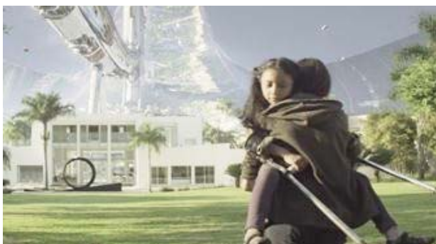
Foto 1. Las personas anhelan encontrar en Elysium la cura para sus problemas de salud.

Policías armados los persiguen, los apalean y los arrestan. Los niños son testigos de la violencia ejercida contra sus padres y contra ellos mismos. En realidad, el sistema operativo de Elysium no reconoce a los foráneos como ciudadanos y solamente los ciudadanos tienen derecho a protección y salud (Foto 2).