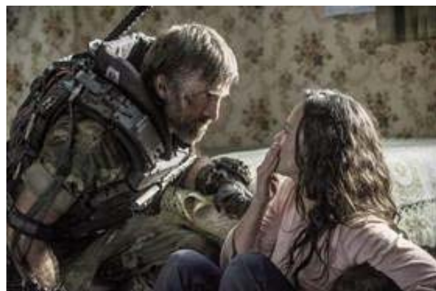
Foto 6. Las mujeres sufren riesgos adicionales en las guerras y desplazamientos humanos.

Las mujeres, como claramente se muestra en la película, sufren riesgos adicionales en las guerras y en los desplazamientos humanos forzados, como violencia, violaciones y el caer en redes de tráfico para comercio sexual 10 (Foto 6).