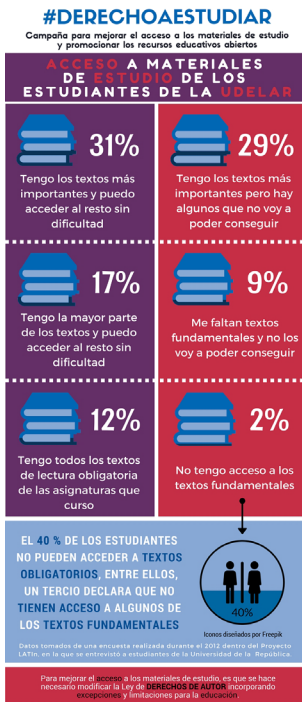
Fig. 3. Acceso a los materiales de estudio de los estudiantes de la UDELAR

La tercera infografía alude al impacto de la compra de libros de texto en el presupuesto de los estudiantes de la UDELAR. Cerca de 20% afirmó que no compraba libros, mientras que 57% aseguró que la compra de libros de textos universitarios le insumía una parte significativa de su presupuesto.