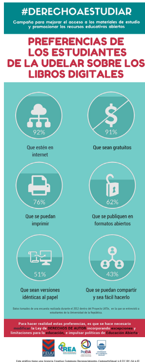
Fig. 6. Preferencias de los estudiantes de la UDELAR con respecto a los libros de texto digitales

La quinta y última infografía refiere a las preferencias de los estudiantes de la UDELAR con respecto a los libros de texto digitales. Los datos que se presentan dan cuenta del interés de los estudiantes respecto al formato digital, con preferencias por la publicación gratuita y abierta. El 92% valoró como “muy importante” que los libros de texto universitarios estén “disponibles en Internet”. La característica que le sigue en importancia es la gratuidad 91% lo consideraron muy importante. Que los libros electrónicos “permitan imprimir libremente los textos” también recibió muchas consideraciones con un 76% de valoraciones como “muy importante”. Un dato destacable es el orden de importancia que le asignan a la demanda de los libros digitales se publiquen en “formatos abiertos” con un 62% de alta valoración.