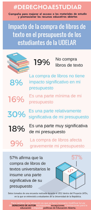
Fig. 4. Impacto de la compra de libros de texto en el presupuesto de los estudiantes de la UDELAR

La tercera infografía alude al impacto de la compra de libros de texto en el presupuesto de los estudiantes de la UDELAR. Cerca de 20% afirmó que no compraba libros, mientras que 57% aseguró que la compra de libros de textos universitarios le insumía una parte significativa de su presupuesto.