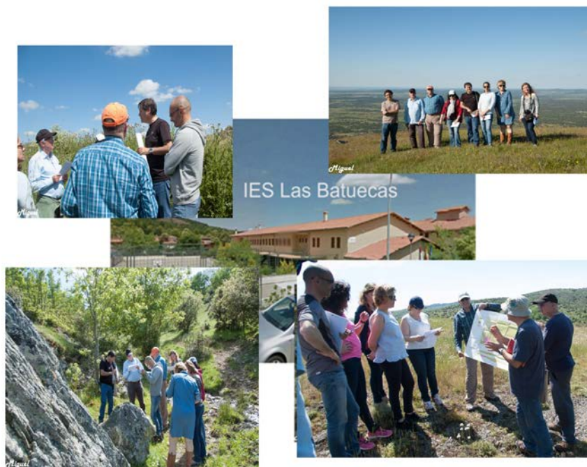
Figura: Imágenes del centro donde se han impartido las conferencias y de los docentes en las salidas de prácticas en Quilamas.