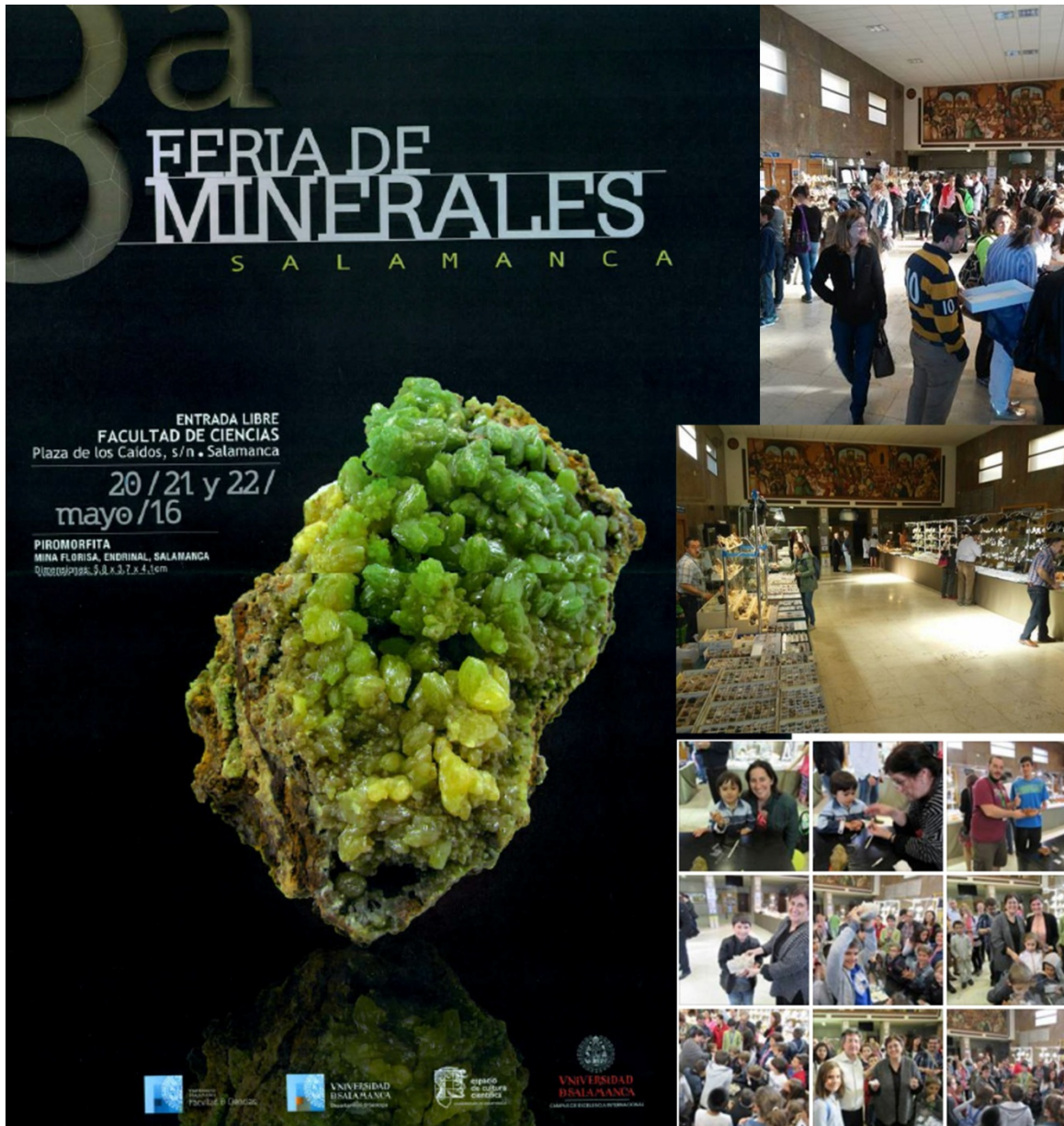
Cartel de la III Feria de los Minerales (2016) (Izq.) y Imágenes del evento (Dcha.)

Este evento ha contado con ponentes de gran nivel en distintos campos de las ciencias geológicas, donde encontramos profesionales internacionales y profesionales de grandes empresas dentro del mundo laboral de la geología.