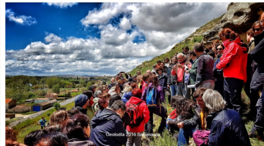
Cartel y guía elaborada para el Geolodia_Salamanca2016 (Izq.) y Imágenes del evento (Dcha.)

El enorme “tirón” social de la actividad se confirma en algunos de los enlaces web y noticias de prensa, que muestran el eco de los diferentes medios de comunicación, en los que ha participado el coordinador de este PID y parte del equipo.