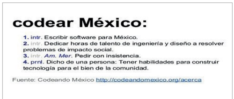
Figura 2. Codear México

presentadas el 4 de abril ante los diputados y se dictaminó la propuesta de Arturo Jamaica como la aplicación ganadora. Lamentablemente y sin explicación alguna, hasta el día de hoy la aplicación no ha sido adoptada por el Congreso ( Morato-Mungaray , 2015).