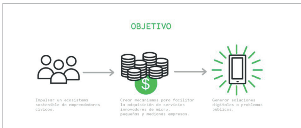
Figura 6. Retos públicos : Objetivos http://retos.datos.gob.mx/acerca