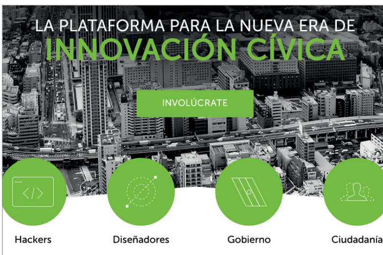
Figura 3. Plataforma de innovación cívica https://espaciocritico25.files.wordpress.com/2014/11/codeandomexico.jpg

Después de la #App115, Codeando México lanzó en mayo de 2013 la plataforma cívica de datos abiertos DataMX . La intención era abrir datos desde la sociedad civil como alternativa a la iniciativa gubernamental datos.gob.mx que carecía de mecanismos claros para publicar nueva información e involucrar al ciudadano en el proceso ( Codeando , 2013c). El objetivo fue proporcionar un espacio autónomo para la publicación y consumo de datos, independiente de cualquier gobierno u organización. Se buscaba que fuera una herramienta alineada con los estándares de proyectos e iniciativas internacionales como la Open Government Partnership y la Open Knowledge International que promueven la apertura de datos como parte de las estrate-