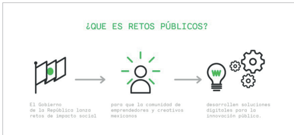
Figura 5. Retos públicos http://retos.datos.gob.mx/acera

La iniciativa de Retos públicos se vinculó e integró posteriormente como una estrategia del Gobierno Federal para el cumplimiento de los objetivos planteados en la Estrategia Digital Nacional presentada en noviembre de 2013 (Gobierno de México, 2014). El proyecto Retos públicos consiste en el desarrollo de convocatorias abiertas para presentar propuestas de solución digital a demandas de la adminis-