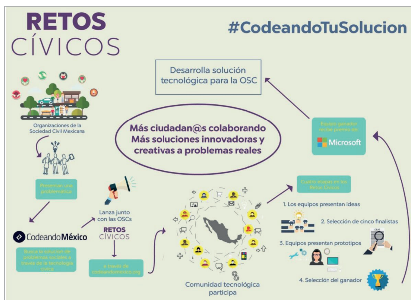
Figura 7. Retos cívicos http://retoscivicos.codeandomexico.org/#

A través de estas comunidades, Codeando México no busca dar una solución a un problema social en particular, sino agrupar a todas las personas interesadas en generar soluciones a los problemas que una o varias comunidades pue-