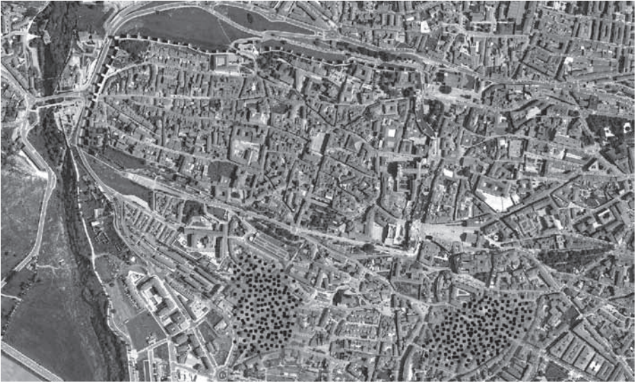
Principales áreas de vecindad de los mudéjares abulenses a finales del siglo XV

quita del mismo nombre, que convivió durante un tiempo con las zonas más antiguas, pero se mantuvo hasta la conversión de 1502. Y una nueva morería “cabe la Trinidad” creada a partir de la imposición de las medidas de 1480, denominada “morería del Berrocal” o “del Camino de las Vacas” y que ocupó casas pertenecientes al monasterio premostratense de Sancti Spiritus, que sustituyó así a la catedral de Ávila como principal institución que entregaba sus casas a censo a musulmanes.