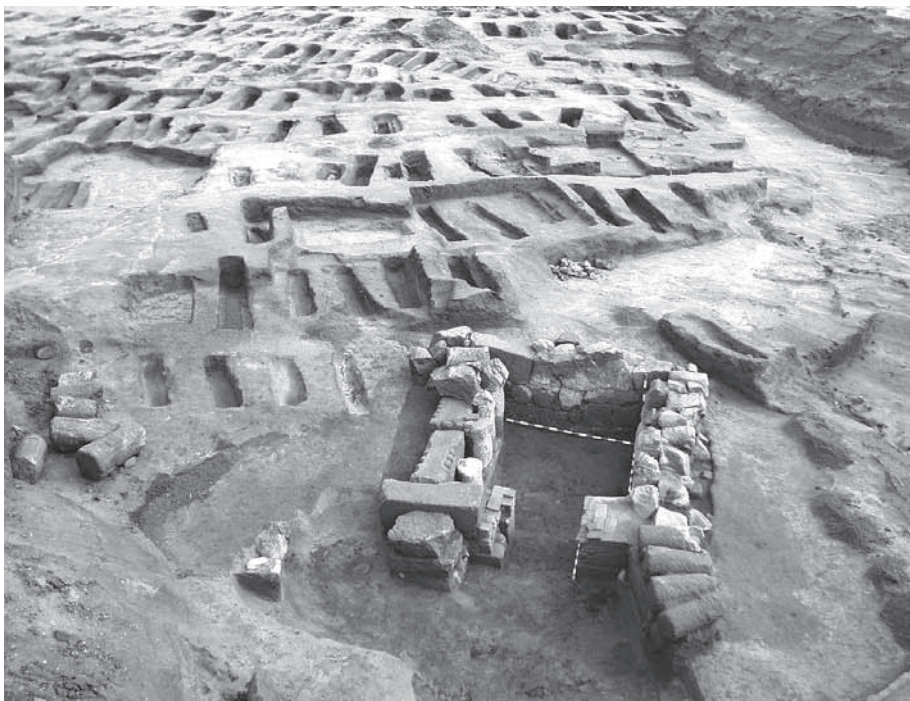
Maqbara de San Nicolás

necrópolis islámica ( maqbara ), debido al tipo de enterramiento documentado, con los cuerpos colocados en posición decúbito lateral derecho y la mirada del difunto hacia La Meca. Las fosas que para ello se practicaron en la tierra eran simples y estrechas, orientadas este-oeste o noreste-sudoeste, con las paredes a veces reforzadas con piedras o ladrillos. También conforme al ritual islámico, los cuerpos se enterraban generalmente sin ajuar, siendo excepcionales los elementos de adorno aparecidos, como algunas pulseras o pendientes (14) .