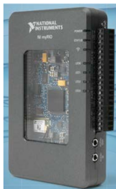
Fig. 1. Dispositivo NI myRIO

1.- Los elementos más costosos y fundamentales para la construcción del relé son los dispositivo NI myRIO de National Instruments cuyo aspecto se muestra en la figura 1.