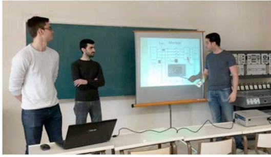
Exposición del funcionamiento del relé