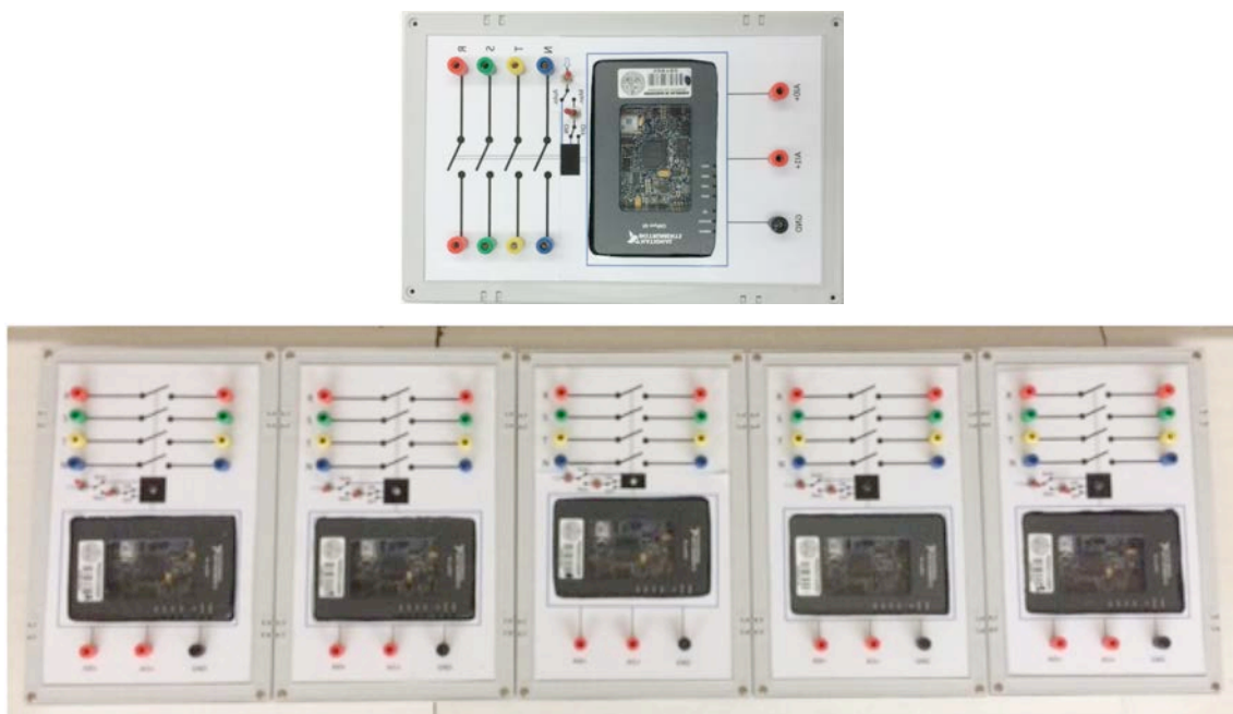
Fig. 2. Aspecto de los relés de protección construidos.

2.- Se diseñaron y construyeron 5 relés de protección como los mostrados en las siguientes figuras. Cada relé estaba constituido por una caja que albergaba un myRIO y los elementos y conexiones necesarios para conectarse el relé a la red eléctrica a proteger a través de los transductores de tensión e intensidad necesarios para su correcto funcionamiento.