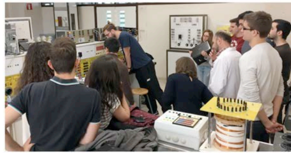
Ensayos del relé