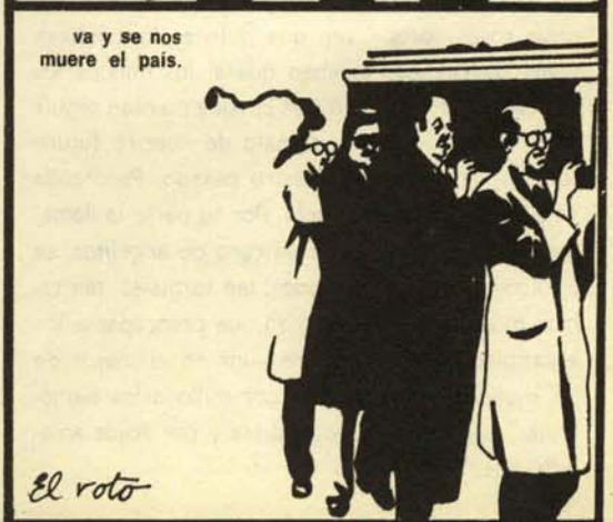
va y se nos muere el país.