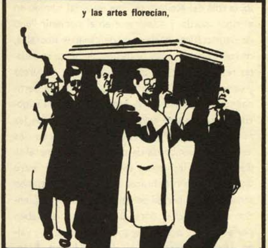
y las artes florecían,