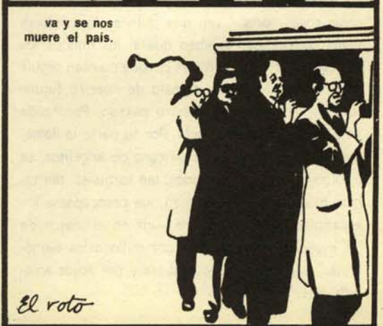
va y se nos muere el país.