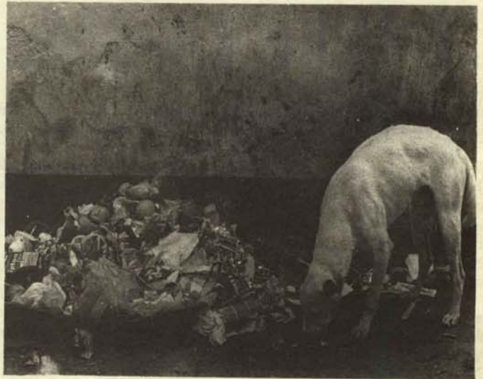
Joven reportero olfateando la noticia.