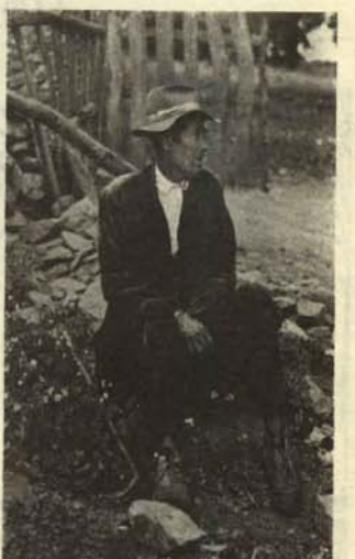
El pensador de Rodin pensando en sus cosas (sociales).