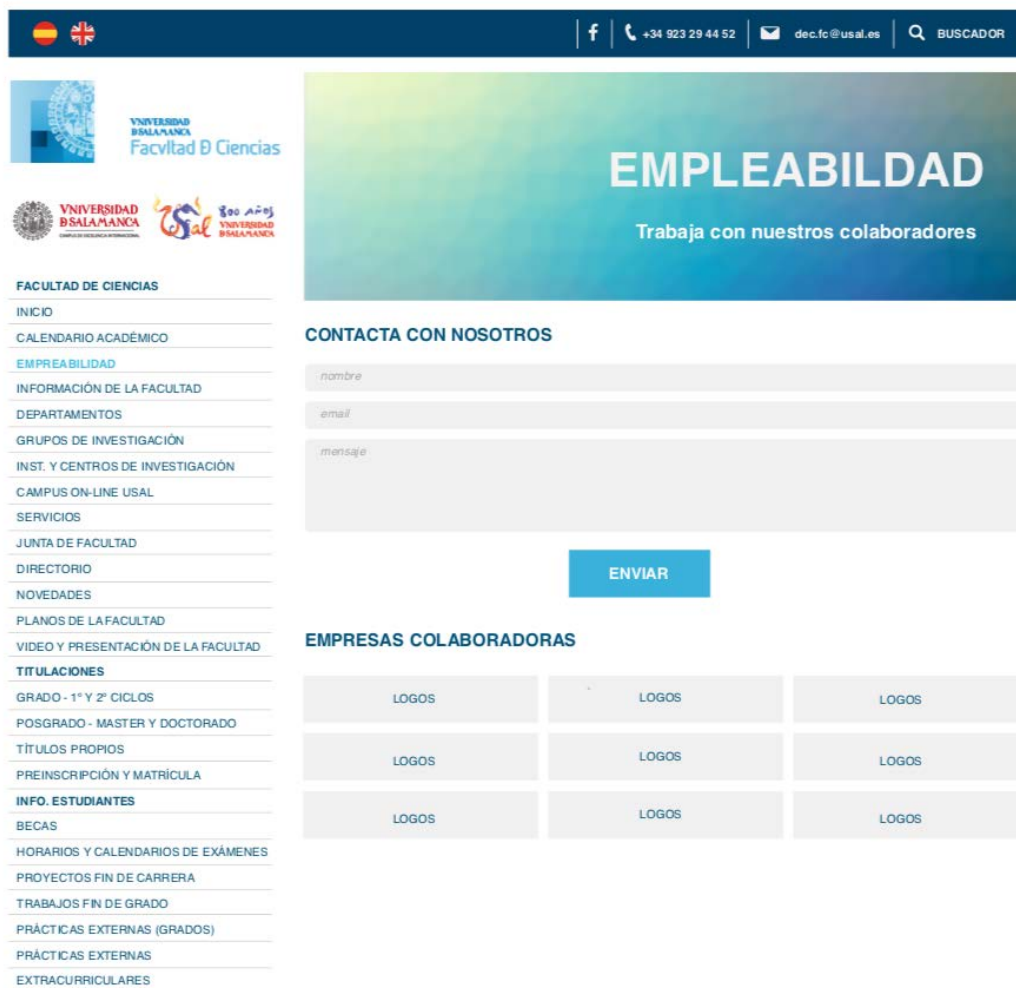
Ilustración 2.- Plataforma social de empleabilidad

En la siguiente captura de pantalla se muestra la maqueta de diseño de la plataforma de empleabilidad donde se puede apreciar elementos de la misma, como logos de las empresas colaboradoras, formularios de contacto, etc. Posteriormente se incluirán otros elementos como lista de actividades, ofertas de empleo, etc.