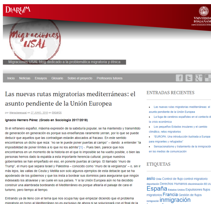
Figura 3. Ejemplo de la entrada en el glosario Migraciones USAL

Los alumnos han presentado una entrada de blog en forma de ensayo sobre una de las temáticas tratada en sus respectivas asignaturas. El propósito de esta tarea ha sido facilitar a los alumnos un espacio en el que puedan exponer los resultados de su trabajo. Se ha optado por publicar sólo los mejores trabajos de los alumnos (los que obtuvieron una valoración por encima de 8 y que destacaron por su originalidad y calidad). En total se han publicado 16 ensayos.