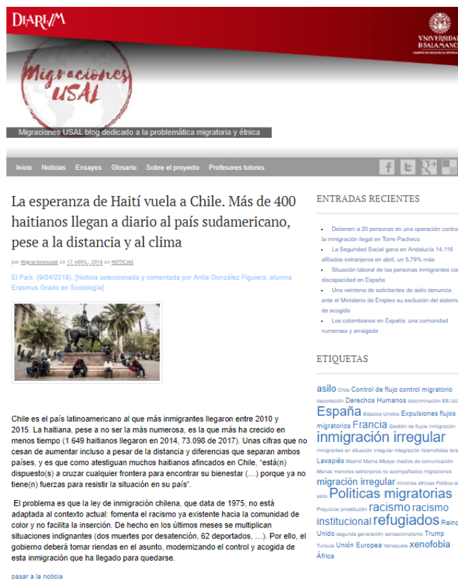
Figura 2. Ejemplo de la entrada en el glosario Migraciones USAL

En total, en el periodo de ejecución del proyecto se han publicado 92 comentarios a artículos de prensa. Los comentarios se basaron en gran parte en artículos de la prensa nacional (El País, Diario.es, Publico, ABC, El Mundo) y agencias de noticias generalistas españolas (Europapress, EFE) pero también de la prensa extranjera (New York Times, La Nación, Repubblica, The Economist, Liberation, Le Figaro, Liberation, Le Monde, Washington Post) y agencias de noticias europeas e internacionales (AFP, Deutsche Welle, Aristegui Noticias).