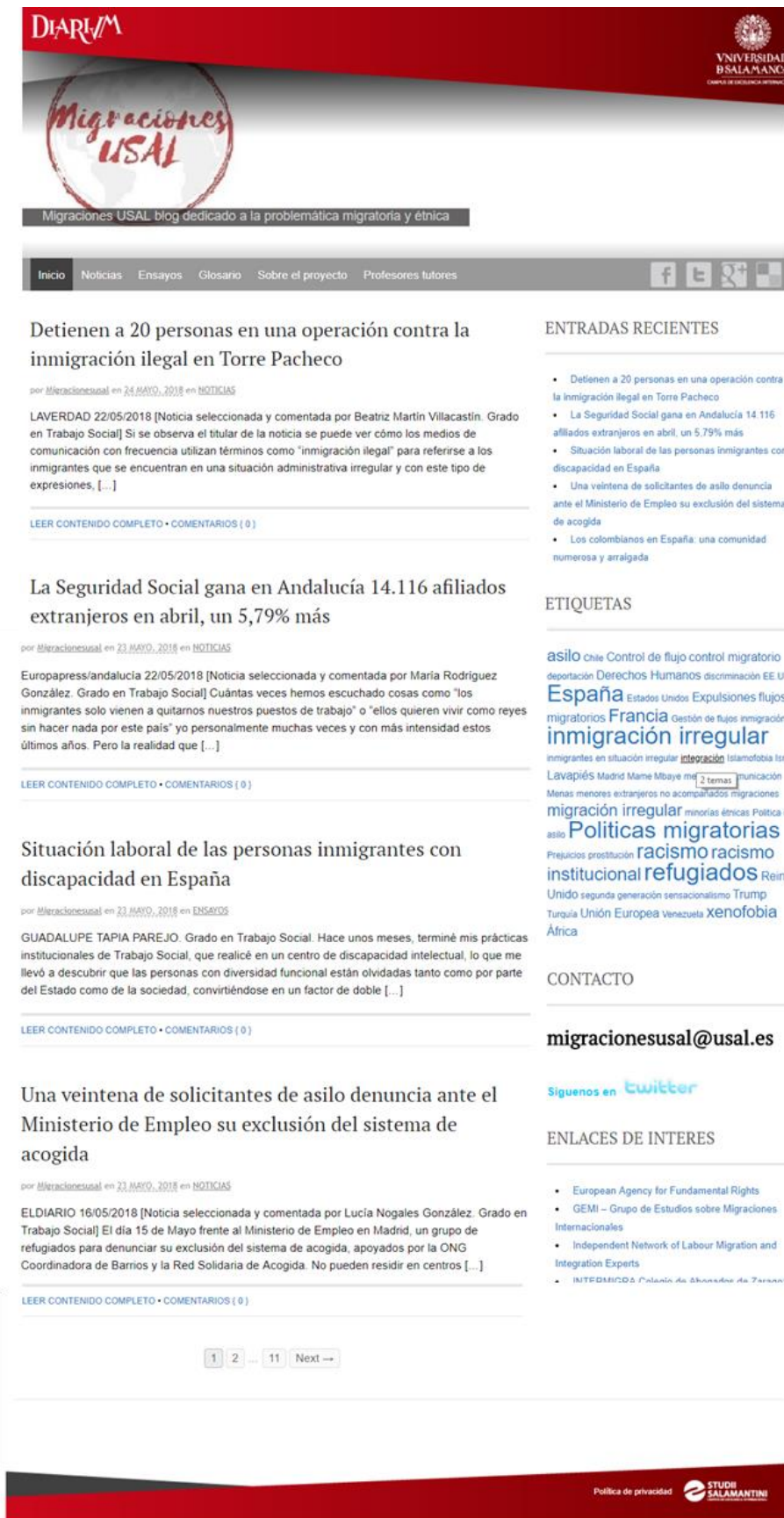
Figura 1 La página de inicio de Migraciones USAL