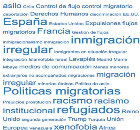
Figura 6. Wordcloud del Blog

La wordcloud de la WEB muestra las etiquetas más frecuentes de las entradas realizadas en la modalidad de Ensayo y Noticia (figura 2). La vigencia y actualidad de los temas tratados se refleja en las etiquetas más frecuentes: España, Inmigración Irregular, Refugiados y Políticas Migratorias.