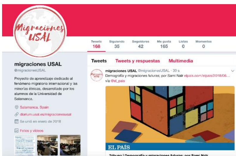
Figura 7. Datos cuenta de twitter

La cuenta de Twitter [ @migraciones USAL ], creada como elemento dinamizador de la asignatura, se ha revelado como una extraordinaria herramienta de difusión de los contenidos de la WEB, 168 tweets, y 166 interacciones (Me gusta), y 42 seguidores tanto individuales como institucionales (Figura 3).