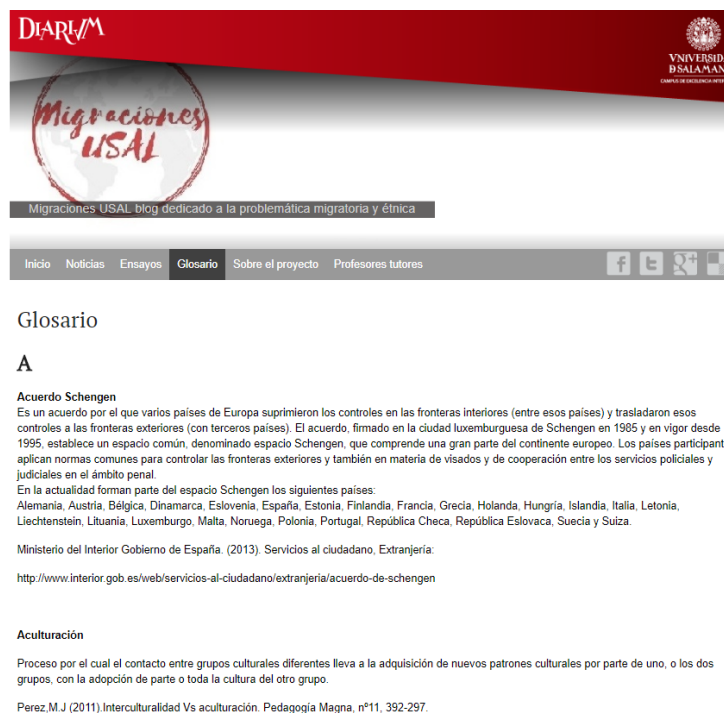
Figura 4. Ejemplo de la entrada en el glosario Migraciones USAL