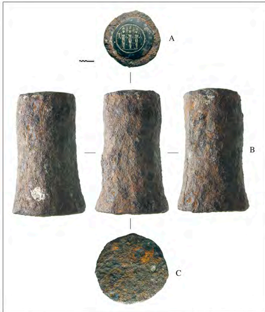
Fig. 1. Cuño de reverso de la serie RRC 486/1: A) visión frontal del cuño de reverso (bronce) y de la caja metálica de hierro en que está embutido; B) desarrollo de la caja metálica (hierro) que envuelve el cuño y C) parte inferior de la caja metálica de hierro