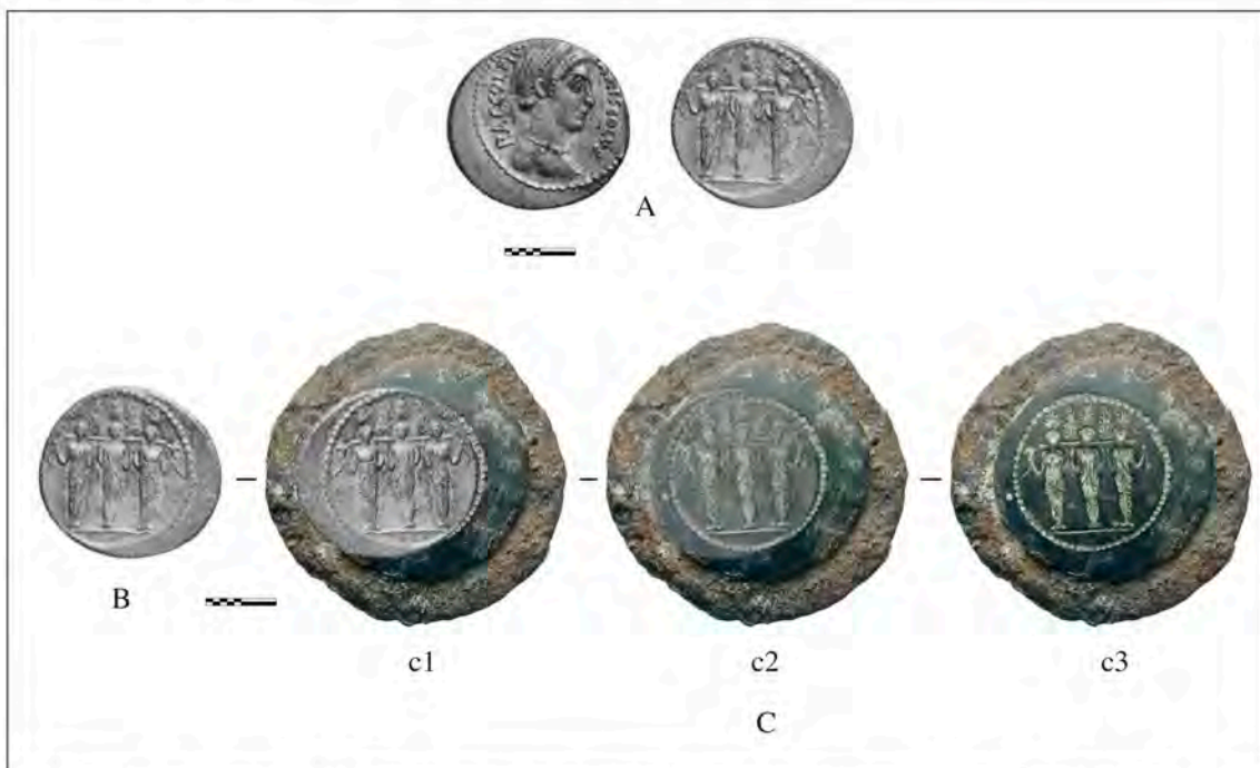
Fig. 2. A) Denario de P. Accoleius Laricolus – estilo inicial III (Oxford): ALFÖLDI 1960, pl. 32, n. 23; B) reverso del mismo denario; C) imágenes modificadas por ordenador: c1) reverso rotado 180° superpuesto al cuño; c2) relleno del reverso al 40% sobre el cuño y c3) cuño de reverso

La relativa abundancia de cuños documentados para esta emisión, que Crawford (9) estima en 84 para el anverso y 93 para el reverso, justifica que las monedas conocidas presenten distintas características y calidades en la ejecución del grabado. Precisamente en base a las diferencias del peinado en el busto femenino representado en el anverso ALFÖLDI (1960:138) propone una ordenación cronológica de las emisiones en tres bloques: a) la primera, con el cabello peinado en la frente en una doble fila de rizos “a lumachella”, mientras que desde la parte superior de la cabeza se desarrollan de forma radial; b) en la segunda este peinado se modifica añadiendo una coleta; c) y finalmente sobre la cabeza aparece una especie de banda textil que cubre el cabello (D'ANGELO y MARTÍN ESQUIVEL 2012:160 y tav. XXIII). Siguiendo las variantes de este investigador para los denarios de P. Accoleio, el grabado de este cuño parece coincidir con las piezas de la primera emisión del tercer estilo ( fig. 2 ) (10) .