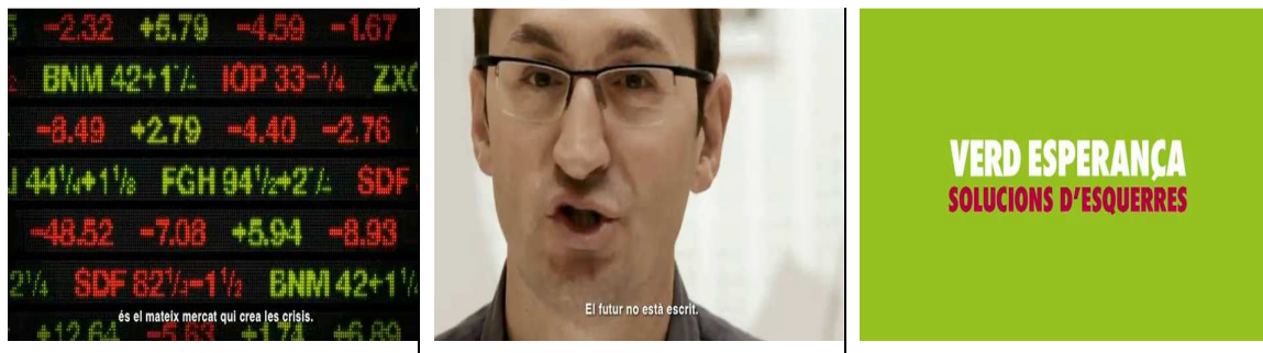
Verd esperança, solucions d'esquerres