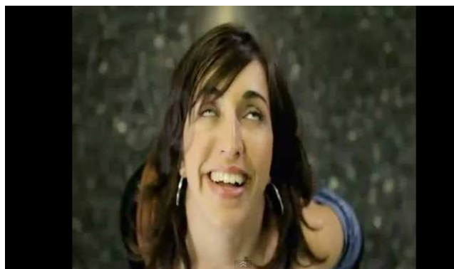
Votar es un placer

Vídeos de este tenor, elaborados con elementos propios del cine erótico — rayanos, en ocasiones, con la pornografía— no resulta sencillo catalogar con arreglo a las categorías clásicas de análisis del spot electoral. Se trata de producciones que aparcan literalmente los temas propios de las campañas, con las que se revela un claro alejamiento de los partidos respecto de las preocupaciones de la ciudadanía, que se adentran en una suerte de “pornografía política” como forma de conseguir una ansiada visibilidad.