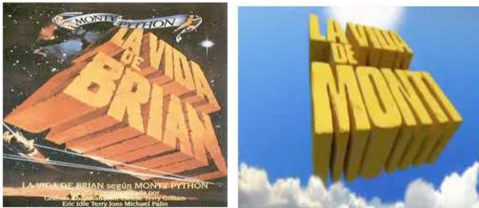
La vida de Brian vs La vida de Montilla

Produjeron un vídeo más en pre-campaña: “Artur Mas de lo mismo”. El protagonista fue el candidato de CiU, Artur Mas, que se presenta con una imagen antigua, plasmada a través de diferentes looks y peinados de corte retro. Pretendía identificar a Mas con el retroceso, evocado gracias a la canción Despeinada que en los años 70 interpretó Adal Ramones. Se trata de un mensaje reiterado en la línea de campaña del PSC, presente en diferentes convocatorias, que se manifiesta con un planteamiento dual y hasta maniqueo: nosotros/el progreso, frente a ellos/CiU, la involución, la vuelta al pasado.