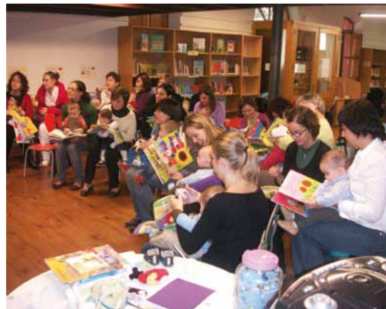
Bebés leyendo con sus madres en la biblioteca.

Las primeras iniciativas las encontramos en EE.UU. a partir de los experimentos realizados en ámbitos pediátricos. Con el objetivo de colaborar en la