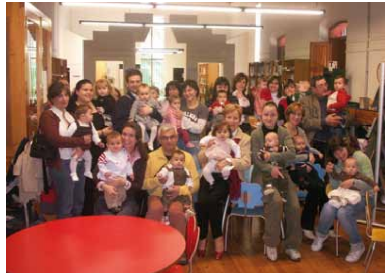
Padres, madres y bebés en la biblioteca.

Los resultados obtenidos hasta ahora (2008-2011) nos animan a continuar con el servicio, ya que, con un coste mínimo, responde satisfactoriamente a una necesidad de información, formación y animación que existía en el barrio sin la respuesta adecuada. La bebeteca representa un nuevo servicio para las bibliotecas públicas orientado a satisfacer una necesidad: