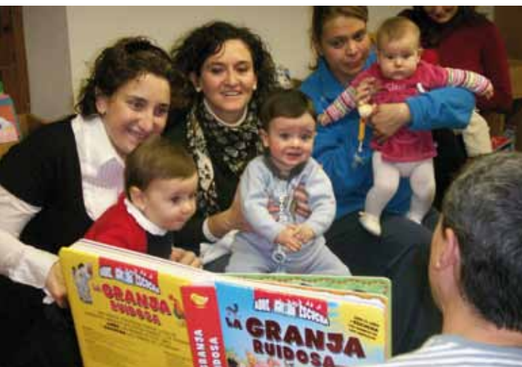
Cuentacuentos para bebés en la biblioteca.

nacimiento llegando al máximo nivel a los tres años de edad. A partir de este momento, las conexiones que no se utilizan van perdiéndose poco a poco y se consolidan aquellas que se usan. La investigación neurofisiológica sugiere que esta “poda” está controlada, en gran parte, por la experiencia sensorial del niño”. Llegados a este punto, ya habremos deducido que las experiencias tempranas con los libros y la lectura propician un fortalecimiento de las conexiones neuronales que intervienen en la alfabetización. Por otro lado, también se ha demostrado que el aprendizaje del habla, la lectura y la escritura es un proceso que empieza muy pronto, antes de que los niños sepan hablar, leer o escribir (alfabetización emergente) 2 .