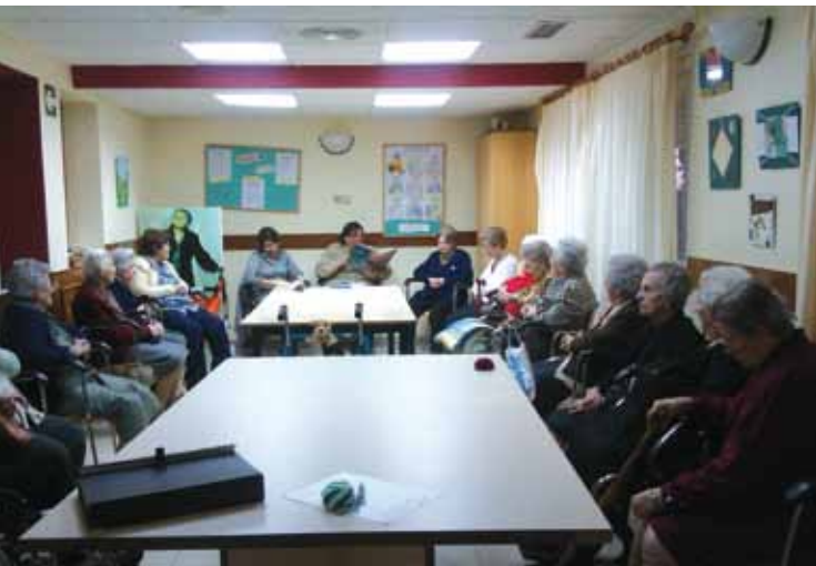
Taller de lectura