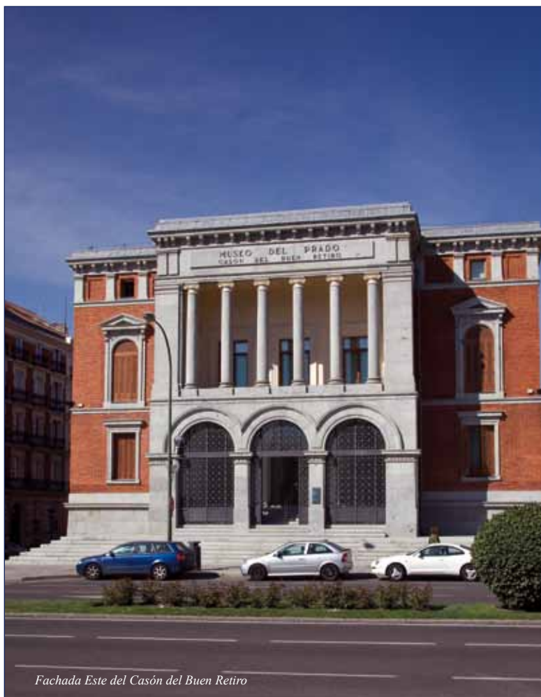
Fachada Este del Casón del Buen Retiro

Estos servicios se han visto mejorados por una notable ampliación del horario de la biblioteca, que ha pasado a ser de 9 a 18 horas, de lunes a jueves, y de 9 a 14:30 el viernes, salvo en el período estival, del 15 de junio al 15 de septiembre, en el que se abre desde las 9 hasta las 14:30 horas a lo largo de toda la semana. Otro servicio en auge, solo disponible para el personal técnico del Museo, es el de Préstamo interbiblio-