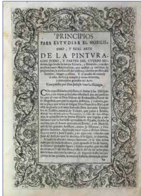
José García Hidalgo, Principio para estudiar el nobilismo y real arte de la pintura (hacia 1700)

-Recursos electrónicos. Uno de los objetivos de la biblioteca en estos años ha sido acrecentar y consolidar una buena colección de recursos electrónicos. Entre los recursos que se ofrecen podemos destacar JSTOR (repositorio de revistas), Oxford Art Online (que da acceso al Grove Art Online , y al Benezit Dictionary of Artists ), Art Price (resultados de subastas) e International Bibliography of Art (base de datos bibliográfica).