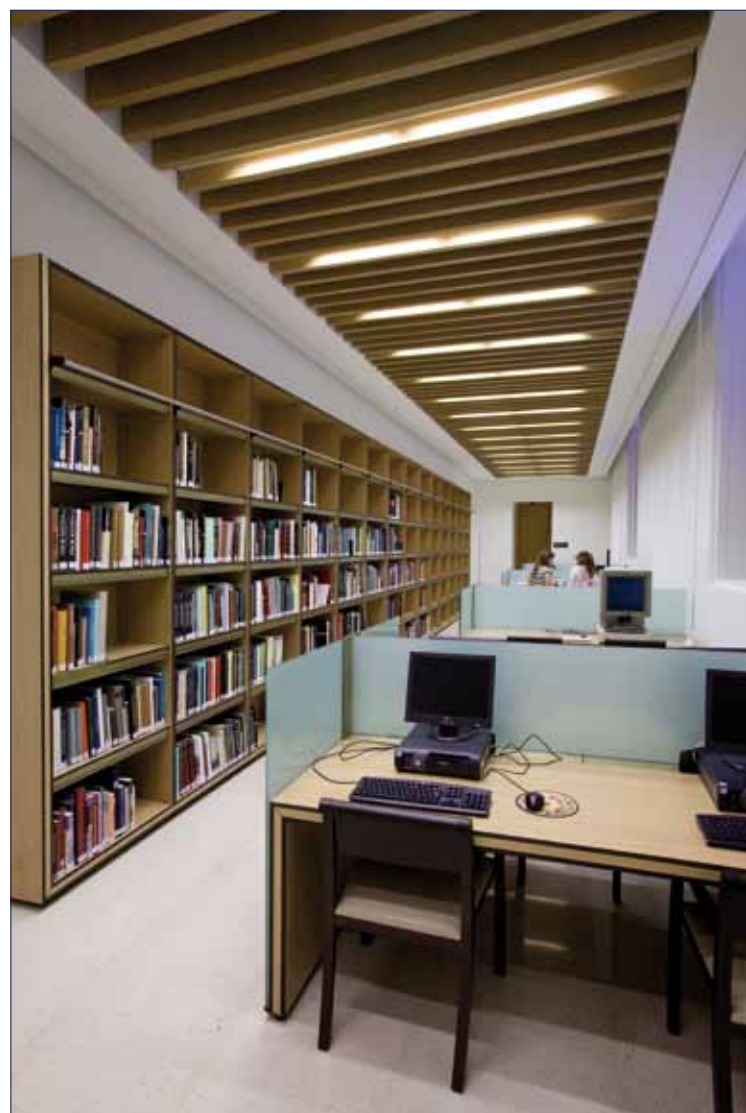
Sala de lectura auxiliar

La Sala de Lectura cuenta con un mostrador de información y consulta y una colección de referencia en libre acceso, organizada de acuerdo a la CDU. En la sala se disponen además expositores de publicaciones periódicas en curso y catálogos de las principales casas de subastas nacionales e internacionales. El resto de los fondos se encuentran en depósitos y pueden ser consultados previa petición al personal de sala. Existen treinta y seis puestos de lectura donde el usuario además de consultar los fondos bibliográficos, archivísticos y documentales del Museo, puede acceder a internet a través del servicio wi-fi. El espacio central se completa con una sala auxiliar, dispuesta de forma paralela donde el usuario puede consultar una completa colección de monografías de artistas, ordenada alfabéticamente, así como acceder a terminales de consulta (OPACs), con el