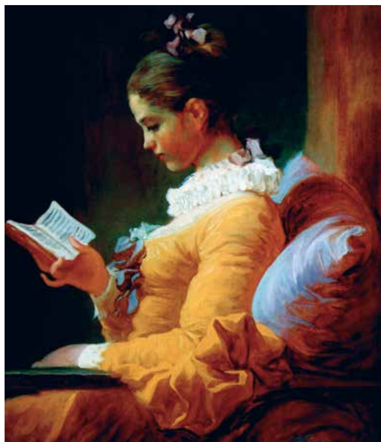
El estudio, Jean Honoré Fragonard, 1769, Museo del Louvre.

En las bibliotecas de mujeres en la Edad Moderna podemos encontrar unos pocos libros, impresos, normalmente pequeños, en lengua romance, con contenidos poco variados: libros de oraciones, libros religiosos y de espiritualidad, de ficción literaria y manuales especializados en variedades o misceláneas, fruto de una lectura intensiva.