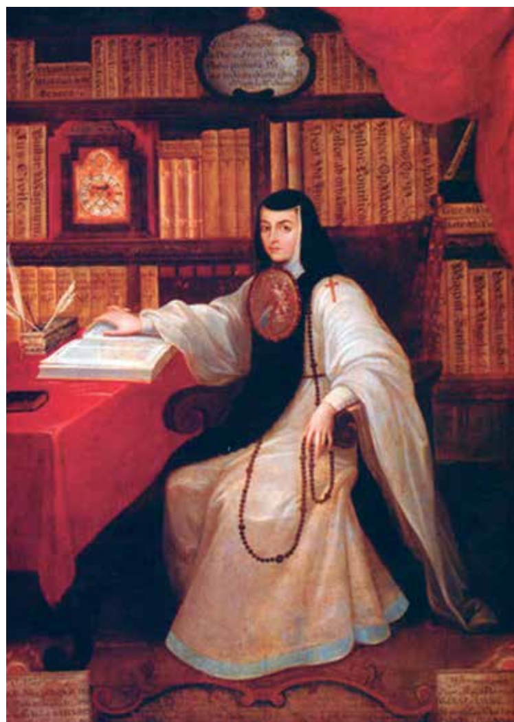
Sor Juana Inés de la Cruz, Miguel Cabrera, hacia 1750, Museo Nacional de Historia de México.

Real Academia Española dice que la biblioteca es el “lugar donde se tiene un considerable número de libros ordenados para la lectura”. Pero, ¿cuánto es un número considerable? Según algunos autores, 15 libros serían los necesarios, o el número mínimo para formar o hablar de una biblioteca. En el caso de las bibliotecas de mujeres, y ante esta afirmación, correríamos el riesgo de no encontrar casi ninguna que supere esta cantidad, y no nos referimos solo a la Edad Moderna. Las bibliotecas de muchas de las mujeres solteras, de la clase media, de la primera mitad del siglo XX, no superarán tampoco los 10 ejemplares. Por tanto, hablamos en la época Moderna de bibliotecas de mujeres con pocos libros, en algunos casos, incluso solo uno, y éste, casi siempre, orientado a la devoción. Mujeres que ejercen una lectura más intensiva que extensiva, que realizan una lectura de pocos libros, pero practicada de una manera más repetitiva. Es verdad que las bibliotecas de mujeres son más reducidas que las de los hombres, pero, ellas, hacen más un uso constante y cotidiano del libro. Debemos de tener en cuenta, que en esta época muchos padres impedían el aprendizaje de la escritura y la lectura