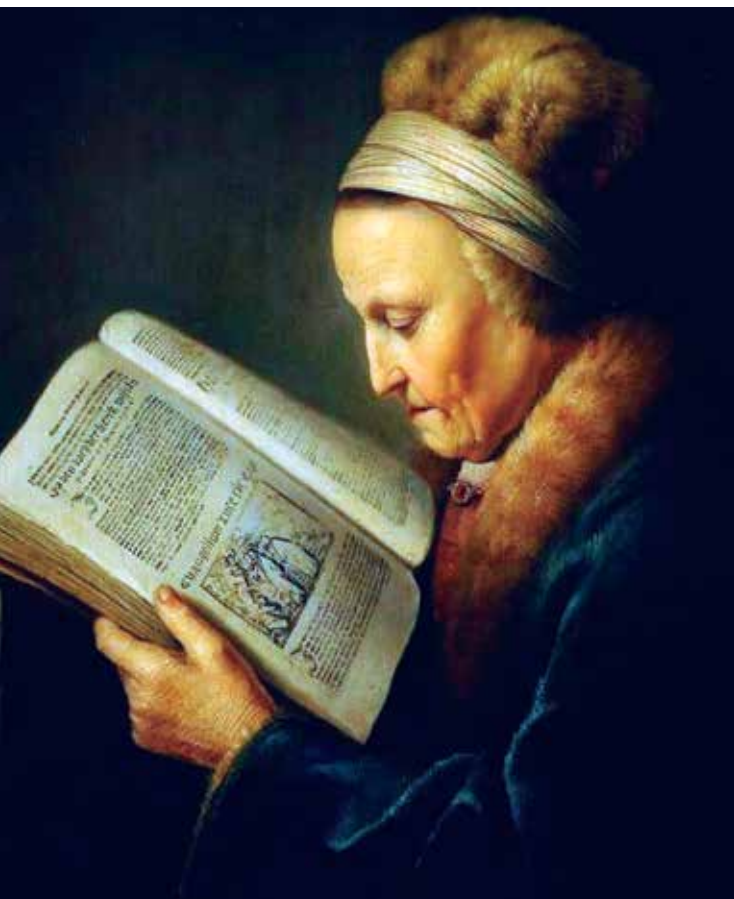
Retrato de la madre de Rembrandt (Anciana leyendo la Biblia), Gerrit Dou, hacia 1630. Museo Nacional de Amsterdam.

Desde el siglo XVI, y sobre todo, desde el siglo XVIII, se quiere atraer a este público potencial femenino, junto a la voluntad de moralizarle, conducir sus comportamientos, y ofrecerle instrucción y entretenimiento, con obras de moral y de economía doméstica, como Instrucción de la mujer cristiana de Luis Vives o La perfecta casada de Fray Luis de León. Todavía las lecturas femeninas eran peligrosas si no estaban cuidadosamente dirigidas.