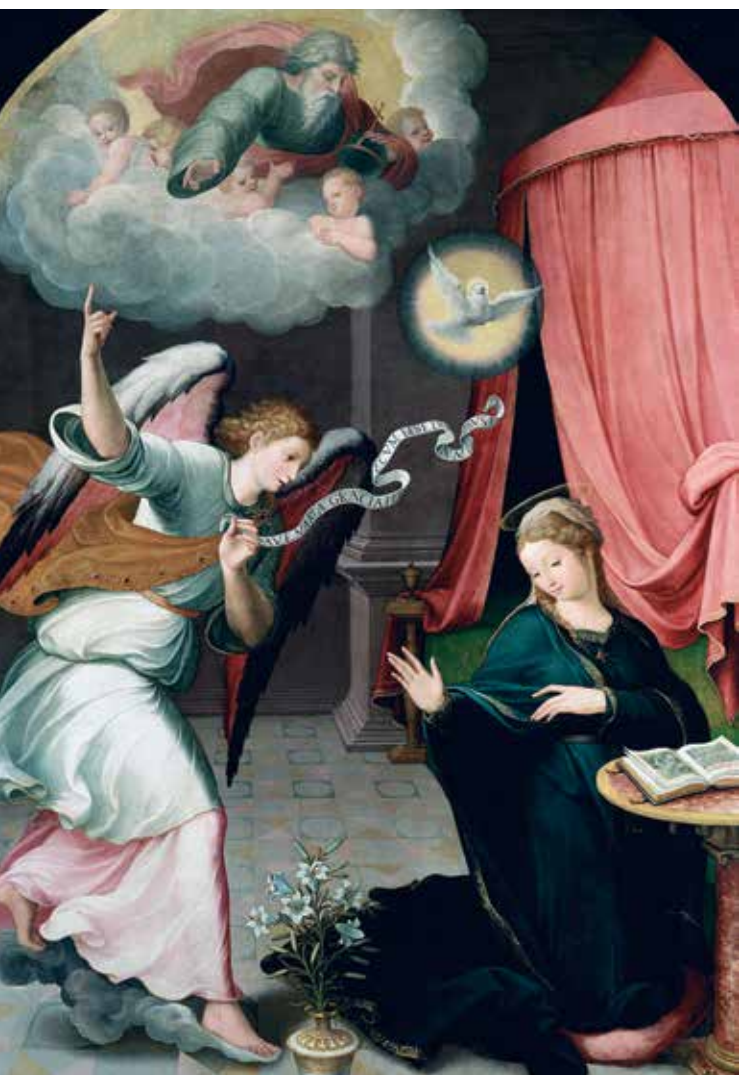
Anunciación, Juan Correa de Vivar, 1559. Museo del Prado.

Pero poseer libros no significa leerlos. En algunos casos las bibliotecas de mujeres son heredadas de sus padres, tíos, maridos, hermanos o sobrinos. Por tanto, los volúmenes de esas bibliotecas no tienen por qué coincidir del todo con los gustos lectores de las mujeres que los heredan.