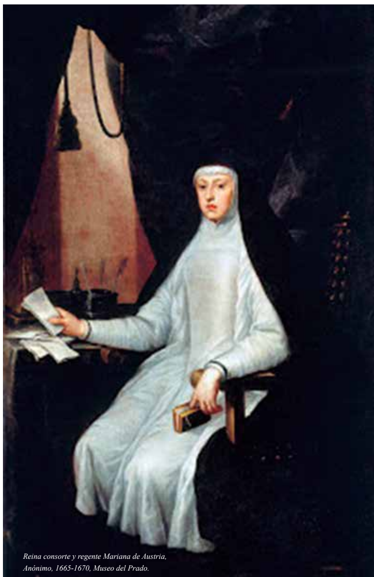
Reina consorte y regente Mariana de Austria. Anónimo, 1665-1670, Museo del Prado.

De entre la literatura de entretenimiento podemos destacar el Amadís , algunos cuentos de Cervantes, La Diana de Jorge de Montemayor, La Celestina , y el Lisandro y Roselia de Sancho de Muñón. En la segunda mitad del siglo XVI, las novedades fueron los libros de pastores, que desde la edición de La Diana , de 1559, gozan de gran éxito, considerándose como