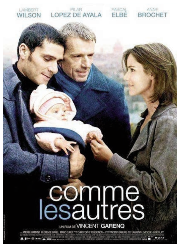
Cartel español de Como los demás.

Manu (pediatra) y Philippe (abogado) forman una pareja estable de cuarentones adinerados residente en París, pero su discrepancia respecto al deseo de paternidad les llevará a una separación amistosa. En solitario Manu inicia un proceso de adopción haciéndose pasar por un soltero heterosexual, pero cuando se descubre que es gay su solicitud es rechazada.