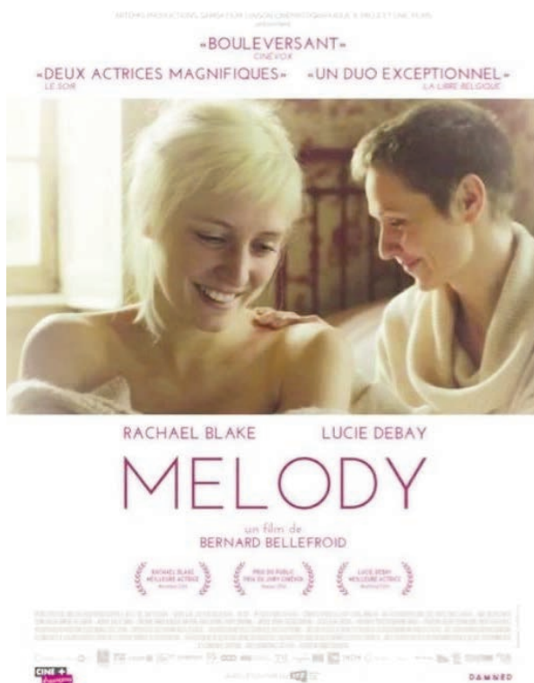
Cartel francés de Melody .

Melody aborda el drama de una joven cuya precariedad económica le impide realizar su sueño: abrir un salón de belleza. Melody vive en un barrio obrero donde peina clientas a domicilio y con las que comparte afecto, complicidades y carencias (Foto 4). Ante la imposibilidad de reunir el dinero para cumplir su proyecto, decide actuar como madre de alquiler. Así conoce a Emily, una dama inglesa de clase alta, a la que un cáncer y su posterior tratamiento truncó su deseo de ser madre.