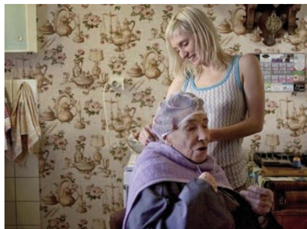
Foto 4. Melody en el domicilio de una cliente.

Emily planifica la fecundación in vitro de Melody a partir de óvulos congelados procedentes de la propia Emily. También organiza la estancia de la joven durante el embarazo y su parto en Ucrania. Pero durante el embarazo Melody empieza a dudar sobre su deseo de renunciar al bebé. A su vez Emily revela su enfermedad y las carencias que se esconden tras su aparente dureza (Foto 5).