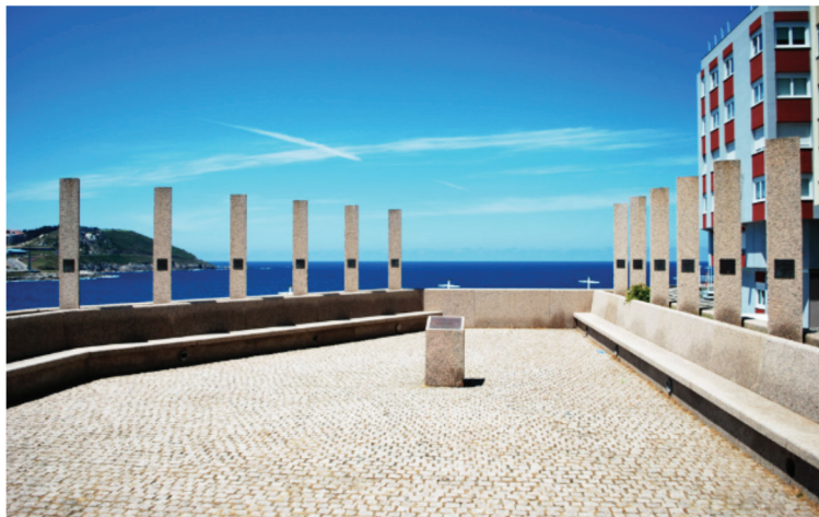
Figura 2. Monumento a la Real Expedición Filantrópica de la Vacuna en el puerto de La Coruña 13 .

porque ha traducido: “queda preservada la especie humana para siempre del contagio varioloso, sin que jamás se haya observado en más de 200,000 mil vacunados que ha habido, el menor peligro, ni resultado daño alguno” 10 .