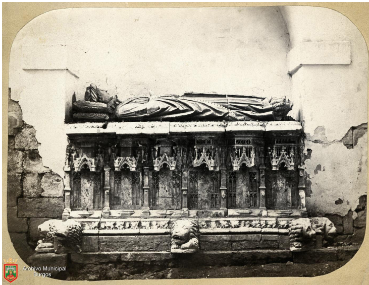
FIGURA 4. El sepulcro de Gómez Manrique antes de su traslado al Museo de Burgos. Archivo del Ayuntamiento de Burgos. Colección Gráfica, FC-3980.

Gómez Manrique falleció en Córdoba el 3 de junio de 1411, siendo enterrado en la capilla mayor de Fresdelval el 8 de julio. Su esposa murió el 16 de octubre de 1437. En el siglo xviii el sepulcro, colocado en origen frente al altar mayor, fue dividido, al entorpecer el desarrollo de los oficios litúrgicos, quedando la mitad con la imagen yacente del adelantado, colocada en el lado del Evangelio y, la de su esposa, bajo la lápida de Luisa Padilla (Figura 4) 16 .