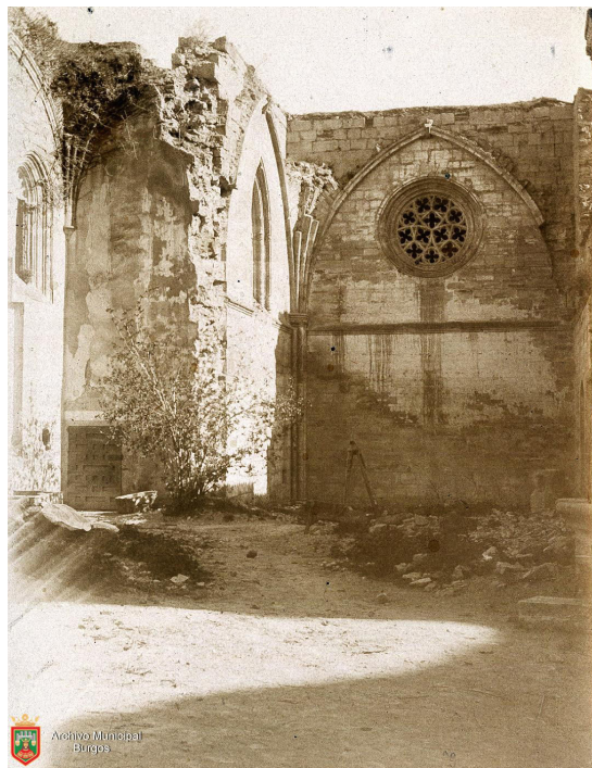
FIGURA 2. Vista parcial de las ruinas de la iglesia del Monasterio de Nuestra Señora de Fresdelval.