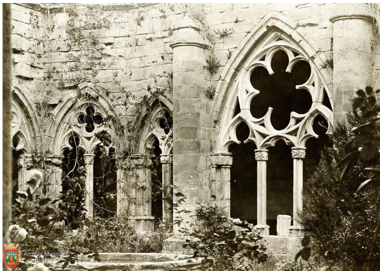
FIGURA 3. Vista parcial del claustro del Monasterio de Nuestra Señora de Fresdelval en ruinas.

Según señaló Carrero, la construcción de las galerías claustrales provocó evidentes desajustes entre los soportes de las bóvedas del claustro y los accesos a las dependencias (Figura 3) 14 . No se conservan restos de la sacristía medieval, situada entre el transepto