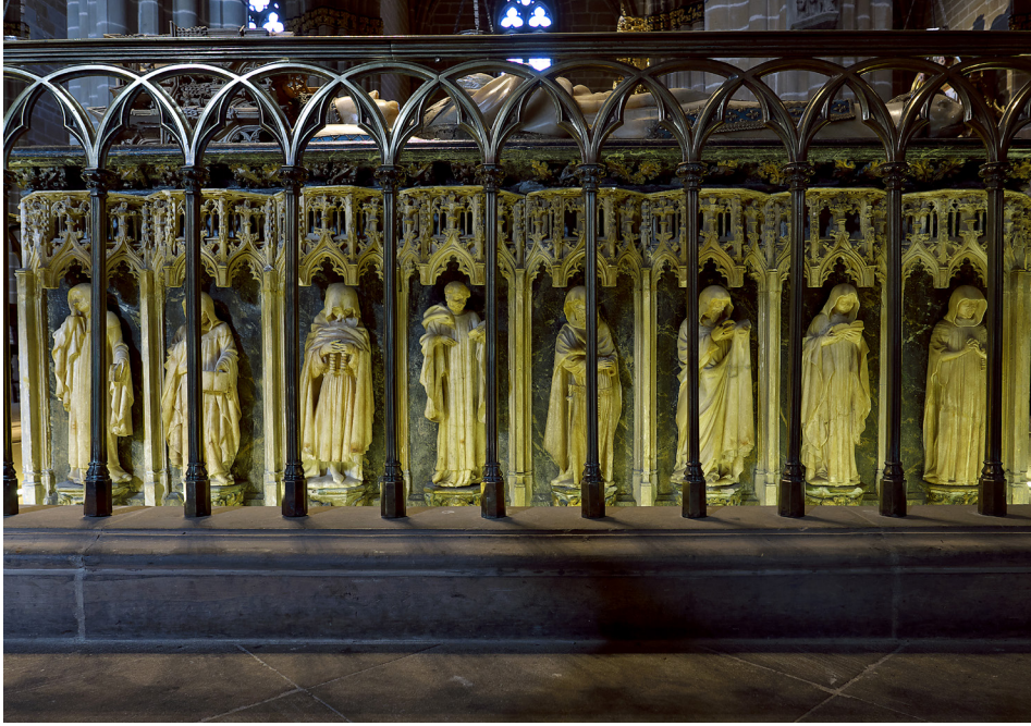
FIGURA 6. Sepulcro de Carlos III el Noble y de Leonor de Trastámara, 1413-1419. Detalle. Catedral de Pamplona.