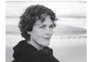
MARIANNE BEATE KIELLAND mezzosoprano