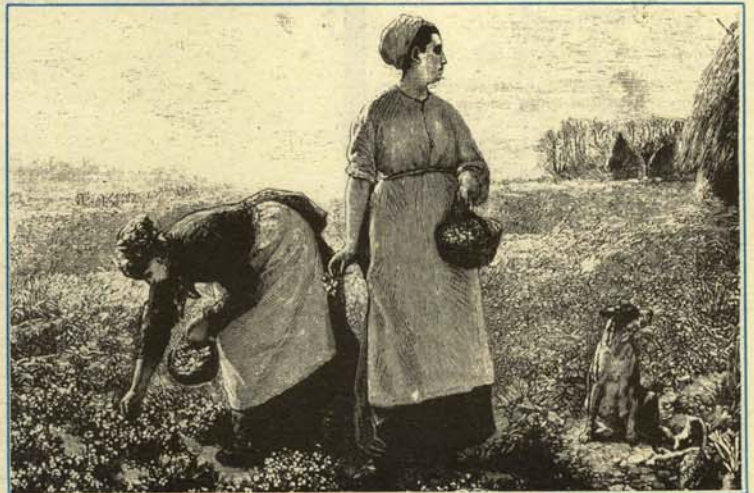
—¡Y pensar que cuando lleguen al horizonte estos pimientos valdrán tres veces más!